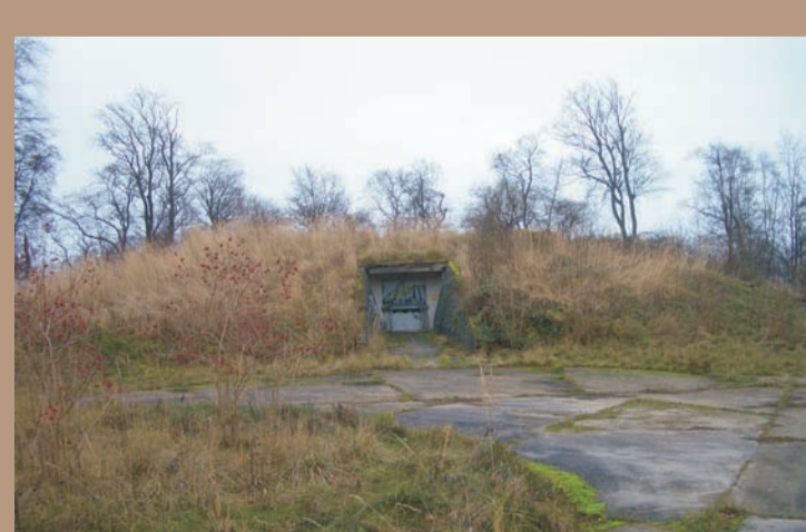
Neben großen, modernen Stahlskulpturen beeinträchtigen auch marode Bunkeranlagen aus der DDR-Zeit heute die Gestaltungszusammenhänge der historischen Anlage.