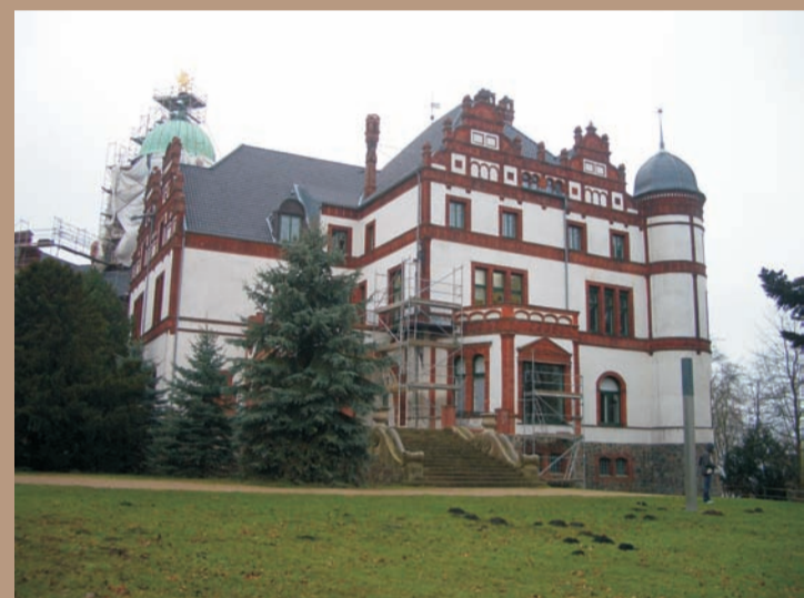
Südseite des Schlosses mit Terrasse heute.