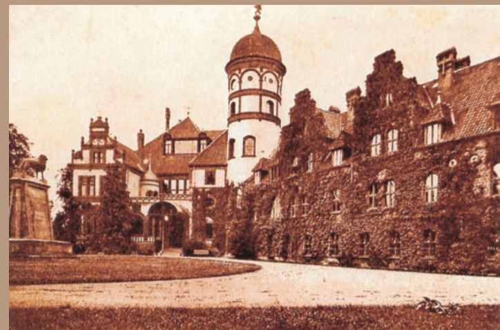
Historischer Schlossvorplatz mit einem Rasenrondell und Bronzelöwen.