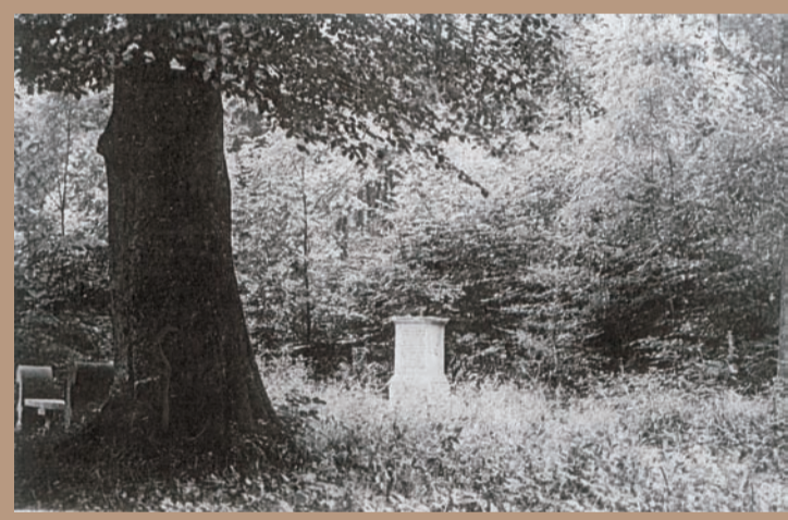
Im Waldpark sind an mehreren, oft versteckten Orten besondere Gedenksteine und ähnliche Kleinarchitekturen zu finden.