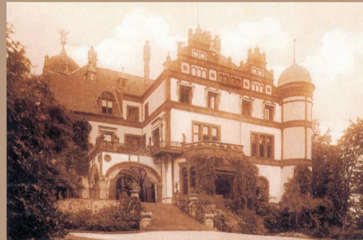
Südseite des Schlosses mit Terrasse um 1920.