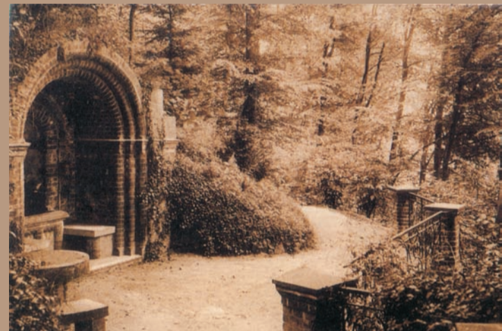
Zu den eindrucksvollsten Kleinarchitekturen im schlossnahen Bereich gehört die Elisabethquelle.