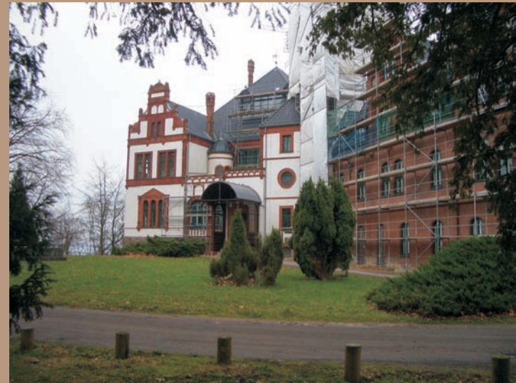
Der Vorplatz heute - Vergleiche von alten Postkarten mit dem heutigen Zustand waren die Grundlage für die Leitbildentwicklung.