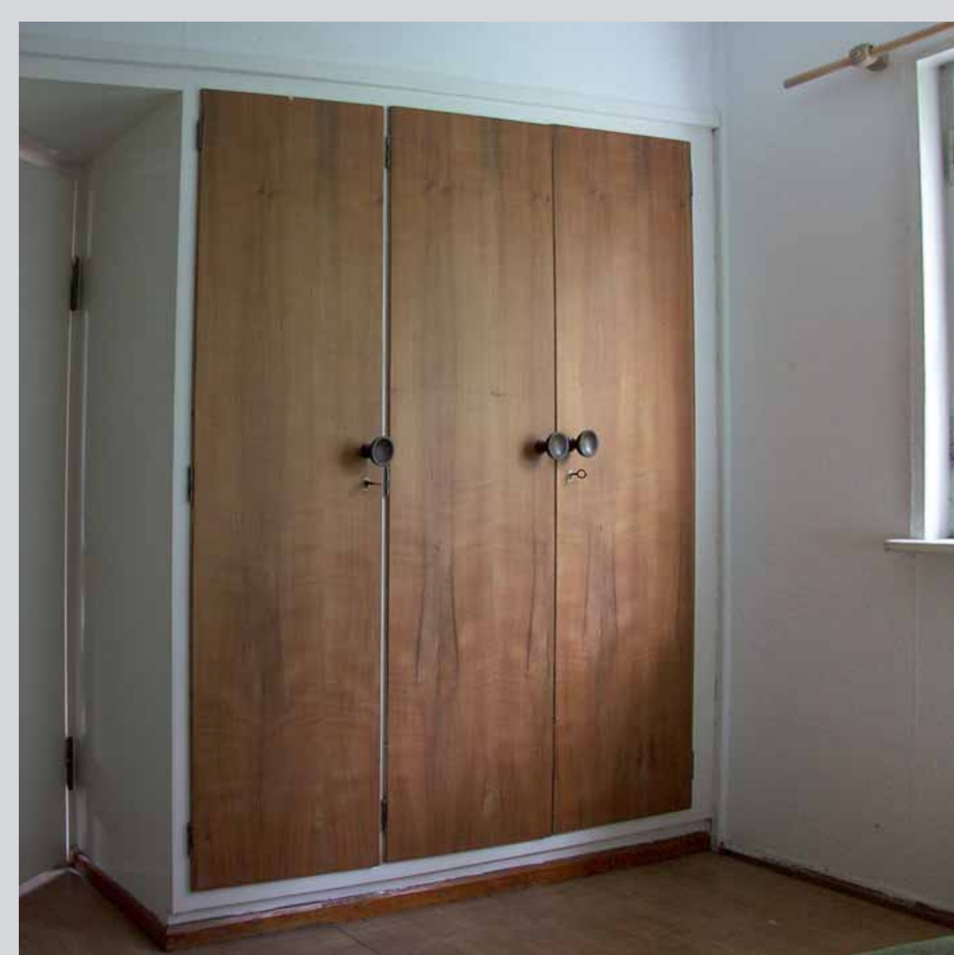
Am Sonnenhang 1, Einbauschränke Schlafzimmer.

DENKMALPFLEGE UND STADTENTWICKLUNG masterstudiengang