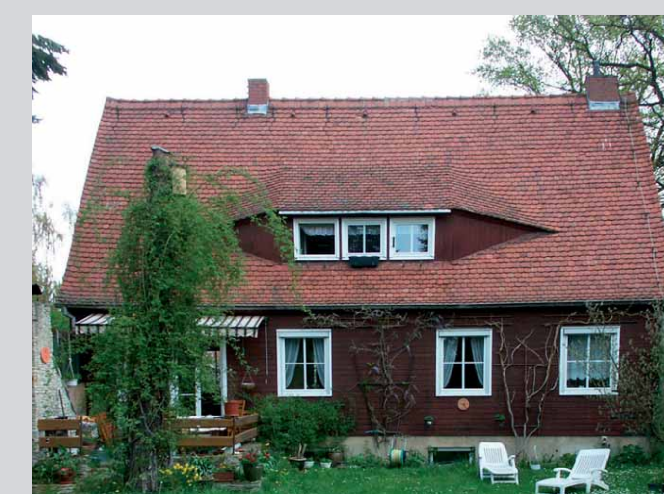
Am Sonnenhang 8. Gartenseite des Holzhauses.