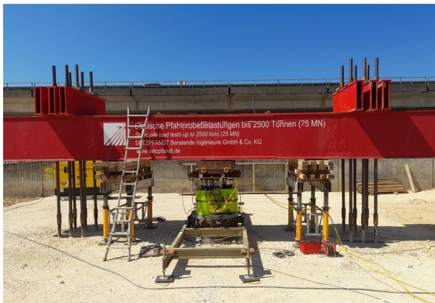
Abb. 1: Statische Axiale Pfahlprobepbelastung mit Traverse und zwei Reaktionspfählen

Zur Bestimmung des tatsächlichen Pfahlwiderstands stellen Pfahlprobepbelastungen das einzige zuverlässige Verfahren dar. Eurocode 7 unterscheidet grundsätzlich zwischen statischen (siehe Abbildung 1) und dynamischen axialen Belastungen. Die Ermittlung von Pfahlwiderständen aus Erfahrungswerten beruht auf der statistischen Auswertung durchgeführter Pfahlprobepbelastungen und unterschätzt daher gezielt die tatsächliche Tragfähigkeit.