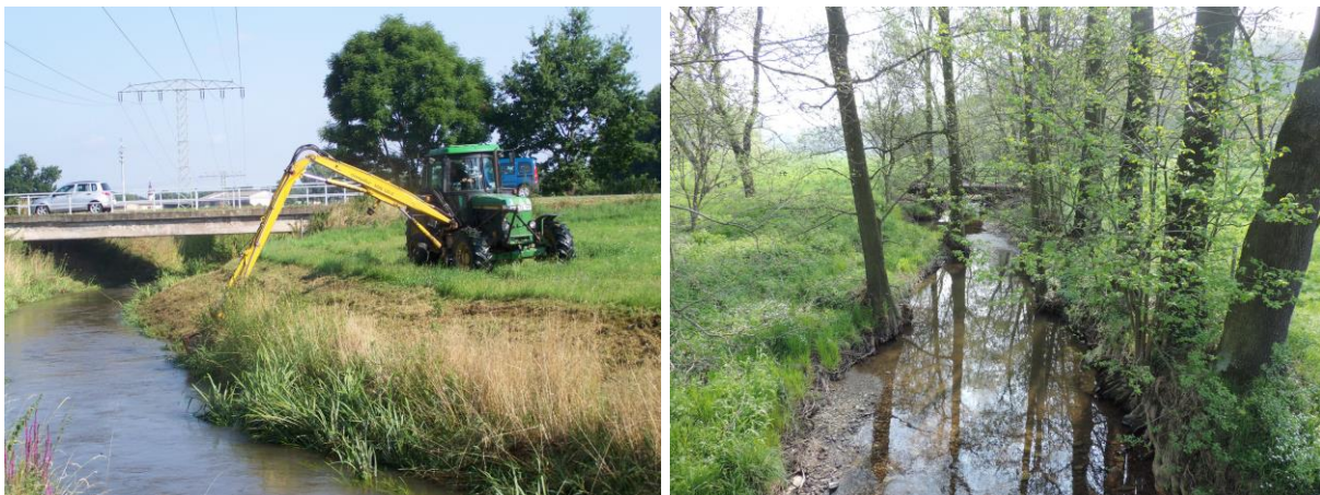
Abbildung 1: Zur Gewährleistung der hydraulischen Leistungsfähigkeit können regelmäßige Gewässerunterhaltungsmaßnahmen erforderlich sein ( links: Böschungsmahd Hoyerswerdaer Schwarzwasser ). Je naturnäher ein Gewässerabschnitt, desto geringer sind die Unterhaltungsaufwendungen ( rechts: Auenbach in Colditz ).

Städte und Gemeinden haben den ökologischen Zustand der Gewässer 2. Ordnung gemäß den Anforderungen der WRRL zu verbessern und Hochwasserrisiken gemäß Hochwasserrisikomanagement-Richtlinie (HWRM-RL) zu verringern. Für diese datenintensive und methodisch anspruchsvolle Aufgabe existiert bisher keine Software, welche die wesentlichen fachlichen und organisatorischen Aspekte der Gewässerunterhaltung (GU) mit integrierter Betrachtung von Hochwasserrisiken auf kommunaler Ebene praxis- und umsetzungsorientiert zusammenführt. Diese Situation besteht, obwohl zum Themenfeld GU und Gewässerentwicklung (GE) viele Studien vorliegen, die für dieses interdisziplinäre Fachgebiet umfangreiches Basiswissen enthalten (z. B. TLUG , 2011; Koenzen et al. , 2010; DWA , 2010; Madsen & Tent , 2000). In einer dieser Studien wurde festgestellt, dass GU-Maßnahmen oftmals nach veralteten Standards erfolgen und nachteilige Auswirkungen auf den ökologischen Zustand der Fließgewässer und/oder das Hochwasserrisiko haben (vgl. Koenzen et al. , 2010, S. 8).