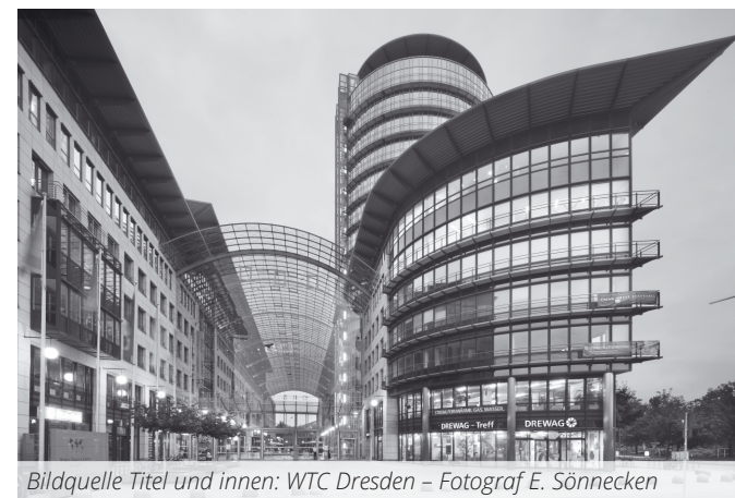
Bildquelle Titel und innen: WTC Dresden – Fotograf E. Sönnecken