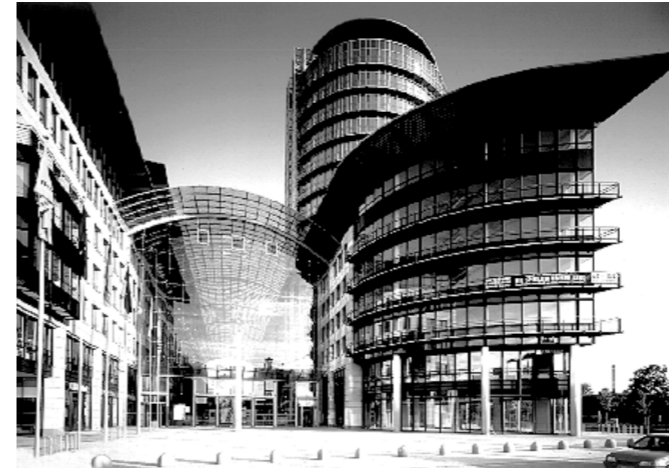
World Trade Center Dresden