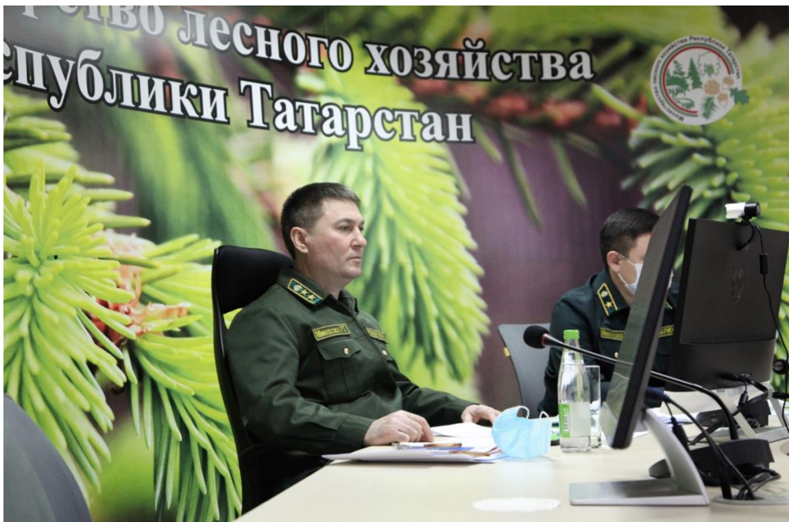
Bild 4,5.