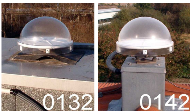
Abb. 2: Fotos der Referenzstationen mit Koordinaten-änderungen in der Höhe, die am weitesten von der mittleren Koordinatenänderung abweichen

Eine mögliche Ursache für die mittlere Abweichung von -13,9 mm kann in der Antennenkalibrierung im Feldverfahren mit Drehung liegen, bei der die Mehrwege-