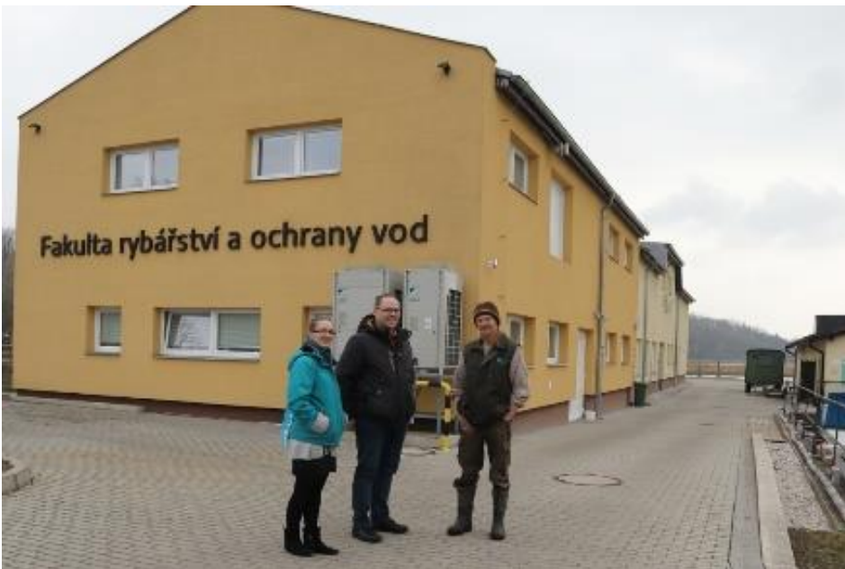
Besuch in Vodnany