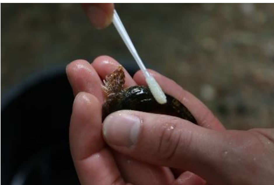
DNA-Probenahme bei Gropfen