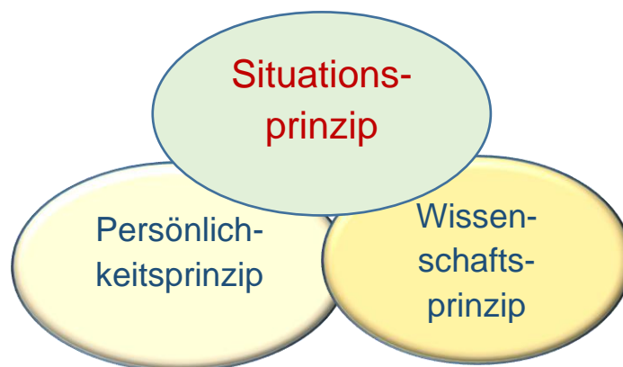
Abb. 1: Makrostrukturelle Ebene der Module (in Anlehnung an Reetz/Seyd 2006; Greb 2013)

Das Persönlichkeitsprinzip wird in erster Linie durch die Kompetenzorientierung und die Ausweisung von Bildungszielen realisiert. In den Bildungszielen werden Widersprüche oder systembedingte Machtverhältnisse, die beispielsweise in Anleitungssituationen erlebt werden, beschrieben, und anhand der Bearbeitung von Themen in den Modulen können diese zu reflexiven Einsichten führen. Diese gehen über umfassende (berufliche) Handlungskompetenzen hinaus und zielen auf die kritische Persönlichkeits- und Identitätsentwicklung der Weiterbildungsteilnehmer/innen. Die Bildungsziele werden in vielen Fällen anhand von Widersprüchen angegeben. Durch das Denken in Widersprüchen können u.a. erlebte Widersprüche bewusst gemacht und gezielt angemessene Handlungsmöglichkeiten gefunden werden. Das Denken in Widersprüchen enthält aber auch das Potenzial, unreflektierte Routinen und Einstellungen zu hinterfragen und zu revidieren oder weiterzuentwickeln.