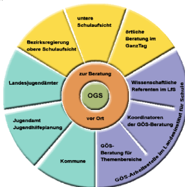
Abb. 3: Beratungsstruktur im Land Nordrhein-Westfalen

Nordrhein-Westfalen hat ein breit angelegtes Beratungs- und Unterstützungsangebot für Ganztagschulen eingerichtet. Die Abbildung 3 veranschaulicht die umfassende Beratungsstruktur der offenen Ganztagschule in Nordrhein-Westfalen (vgl. Ministerium für Schule und Weiterbildung des Landes Nordrhein-Westfalen, o. J.).