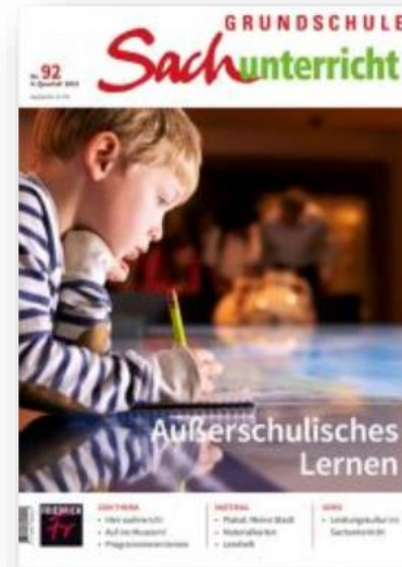
Cover der Fachzeitschrift „Grundschule Sachunterricht“