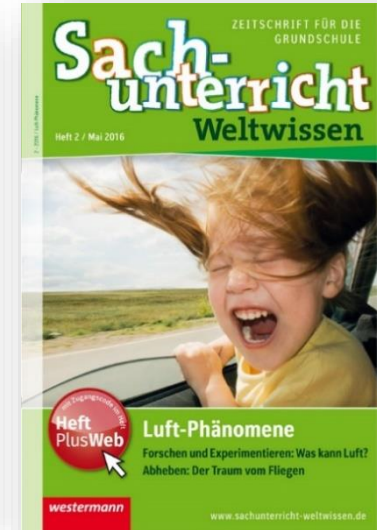
Cover der Fachzeitschrift „Sachunterricht Weltwissen“