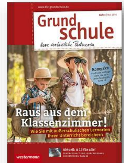
Cover der Fachzeitschrift „Grundschule“