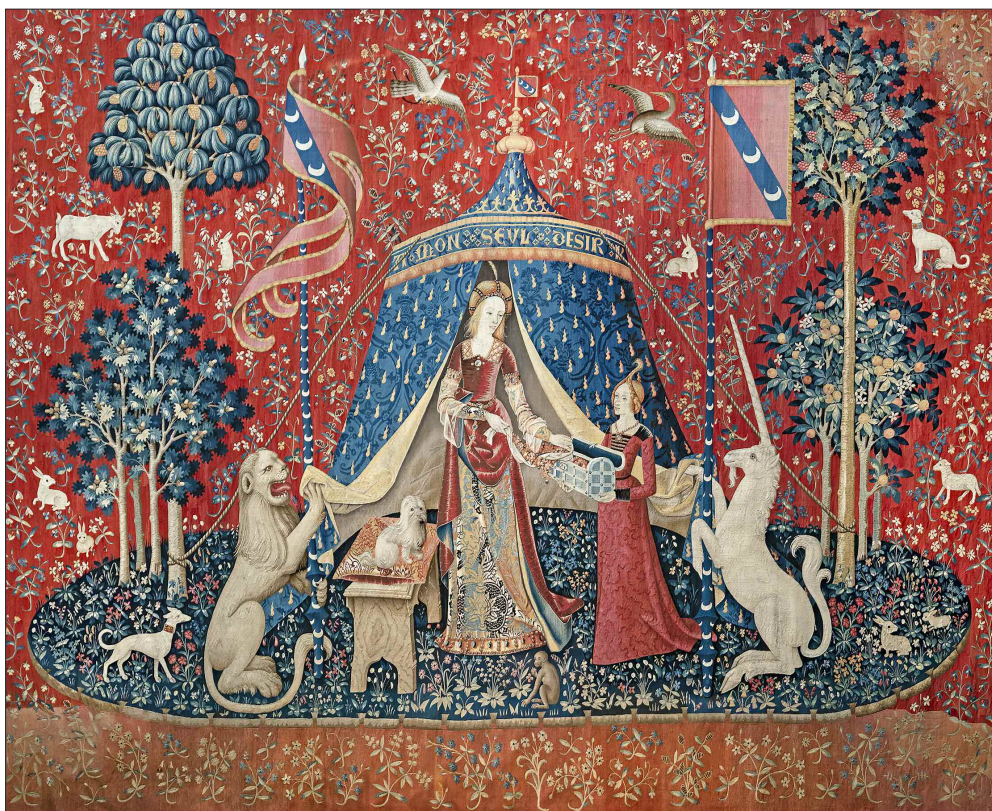
Figure del desiderio

Testi e contesti nel Mediterraneo medievale e oltre