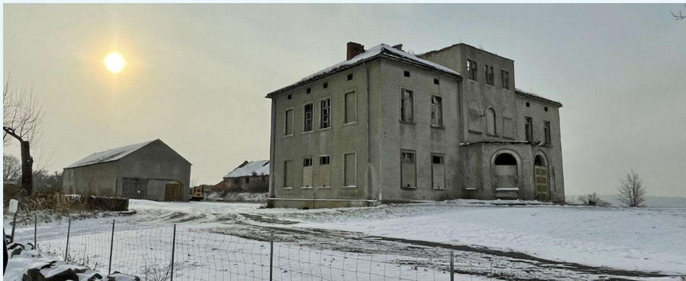
Das ehemalige Gutshaus des Oberhofes in Deutsch Ossig

Wir danken der Stadt Görlitz für die freundliche Aufnahme und Unterstützung: