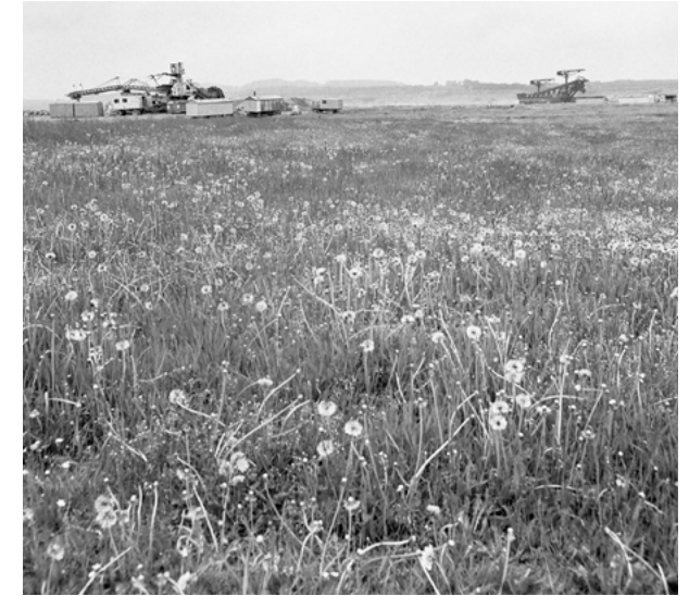
Blick auf den Tagebau Berzdorf 1991/92

Bereits 1991 zeigte eine Studie, dass der damals noch vorhandene Gebäudebestand Deutsch Ossigs revitalisiert, durch Neubauten ergänzt als Teil eines Naherholungsgebiets um den Berzdorfer See entwickelt werden könnte. Aktuell wächst die Nachfrage nach Erholungsraum und Freizeitangeboten am Berzdorfer See und damit der Druck, den Kulturlandschaftsraum intensiv zu entwickeln. Gleichzeitig werden die materiellen und immateriellen