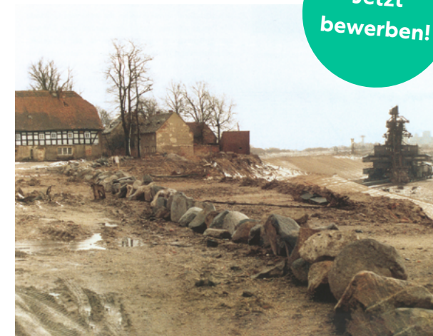
Deutsch Ossig mit Bagger am Dorfrand, um 1998