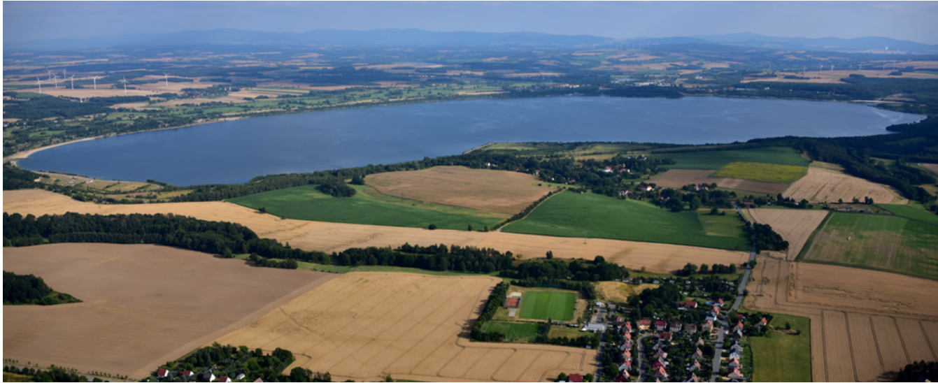
Der geflutete Braunkohletagebau Berzdorf, heute Berzdorfer See