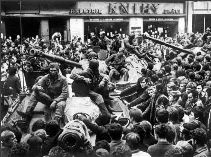
Einmarsch sowjetischer Truppen in die Tschechoslowakei 1968 („Prager Frühling“)