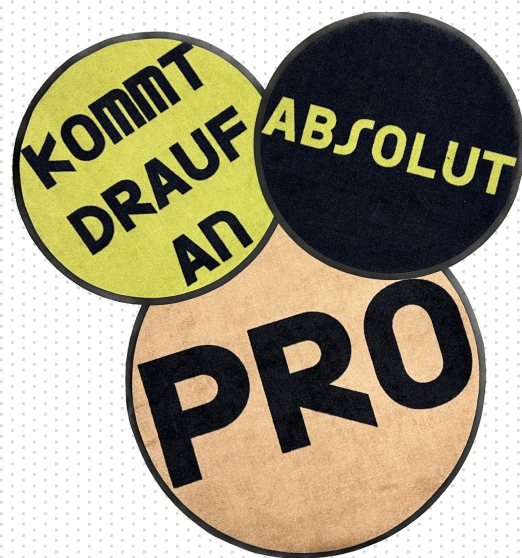
Pro- und Contra-Teppich mit Zwischenpositionierungen

z.B. „Autofahren sollten in Innenstädten verboten werden.“ „Theater und politische Bildung passen gut zusammen.“