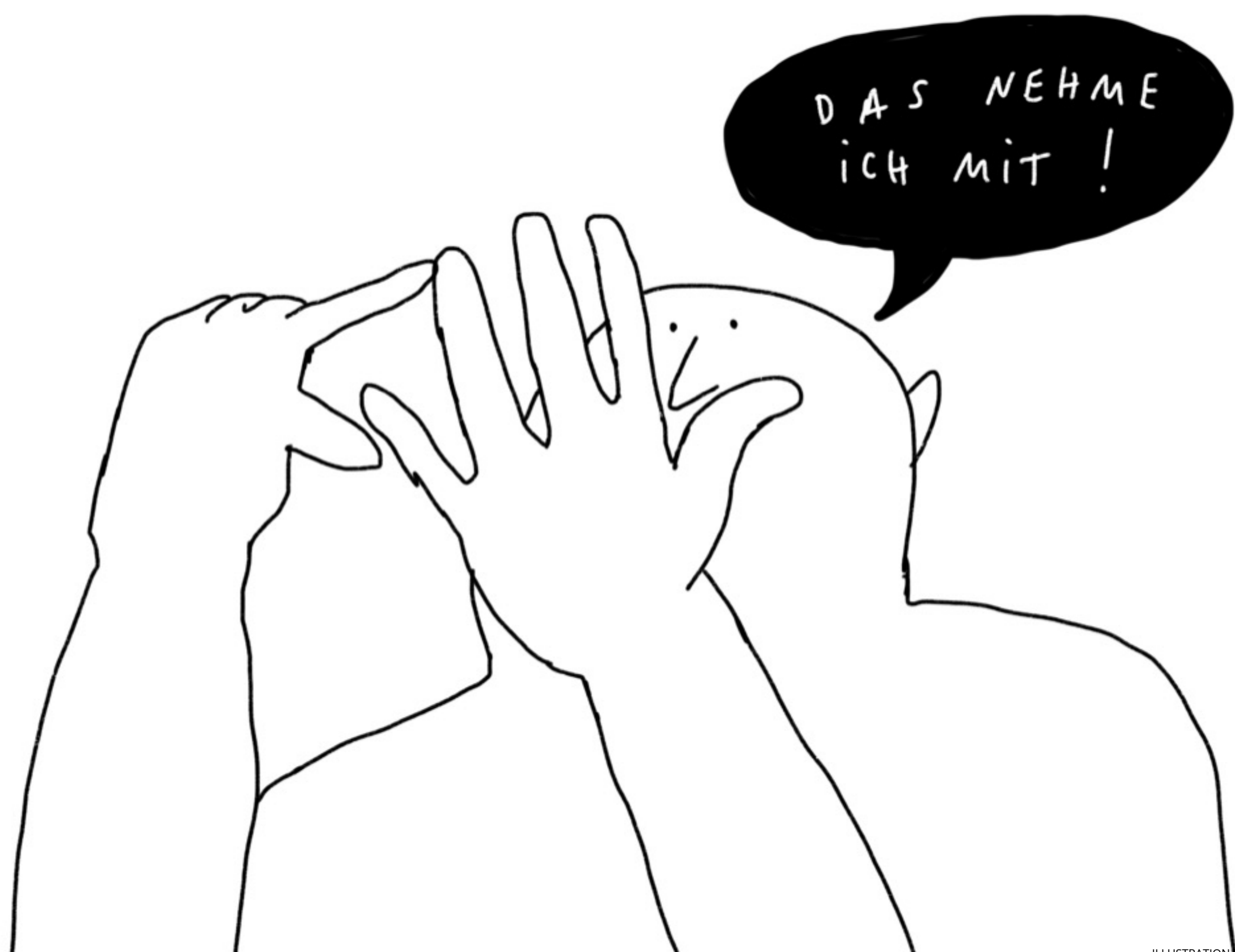
ILLUSTRATION JOHANNA BENZ

DAS IST EIN ARBEITSBLATT AUS DER SERIE RIESENARBEITSBLÄTTER DER JOHN-DEWEY-FORSCHUNGSSTELLE FÜR DIE DIDAKTIK DER DEMOKRATIE