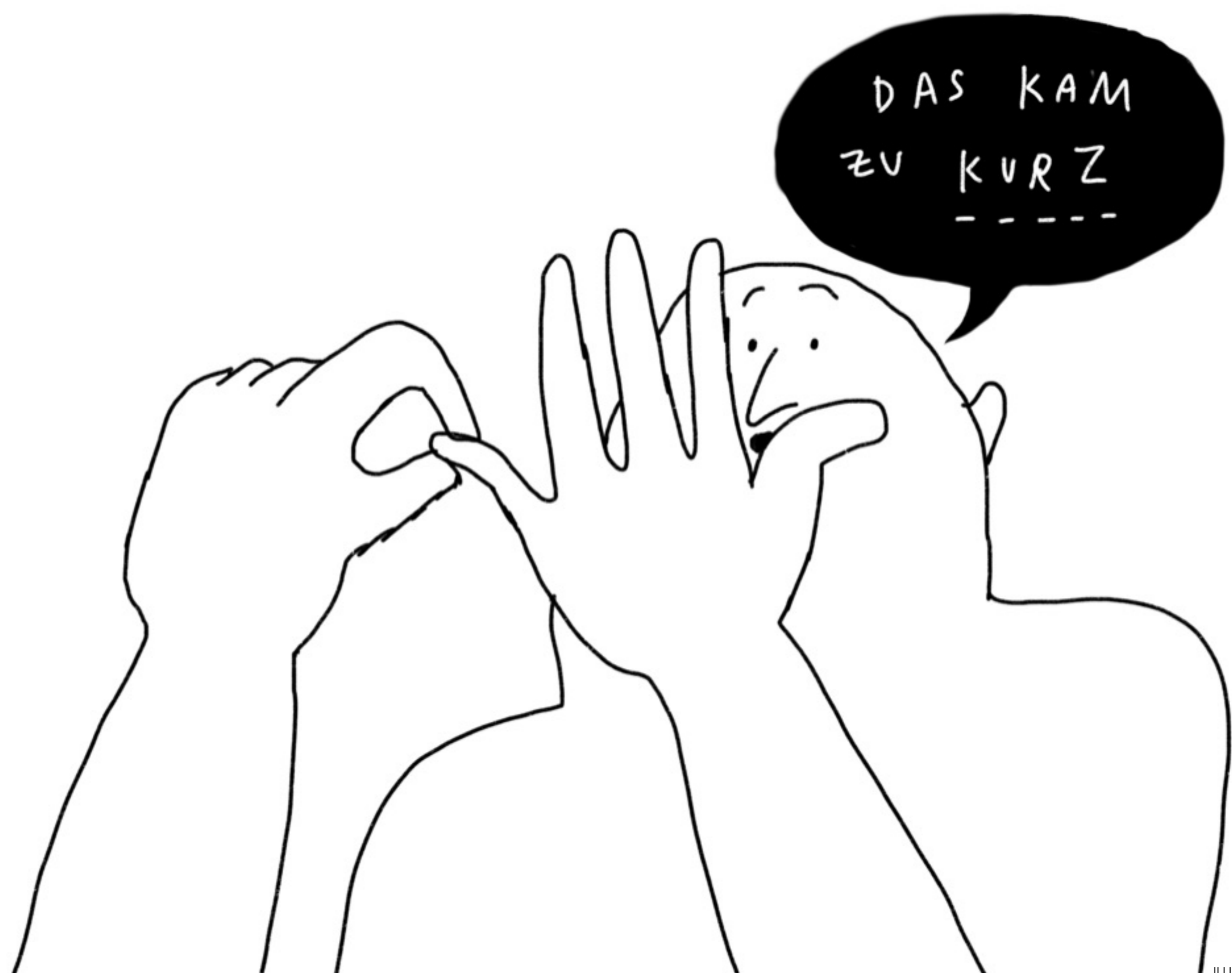
ILLUSTRATION JOHANNA BENZ

DAS IST EIN ARBEITSBLATT AUS DER SERIE RIESENARBEITSBLÄTTER DER JOHN-DEWEY-FORSCHUNGSSTELLE FÜR DIE DIDAKTIK DER DEMOKRATIE