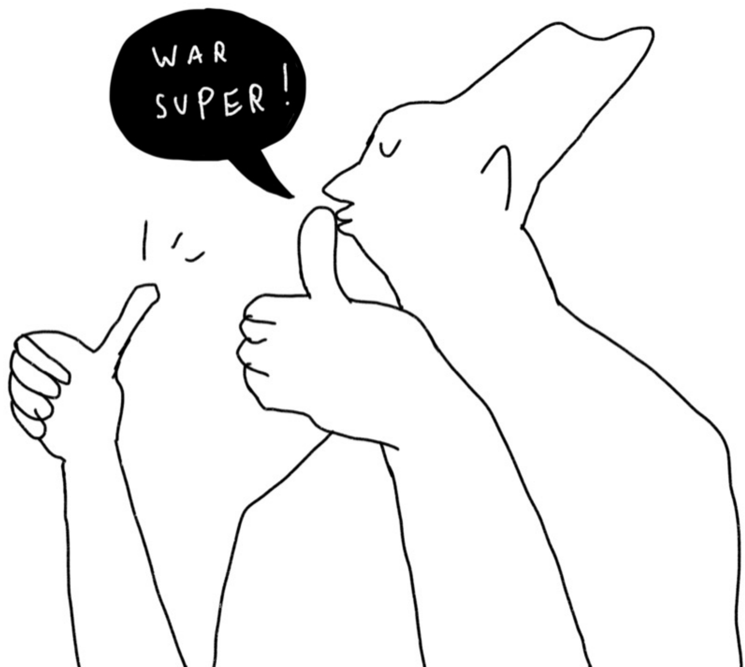
ILLUSTRATION JOHANNA BENZ

DAS IST EIN ARBEITSBLATT AUS DER SERIE RIESENARBEITSBLÄTTER DER JOHN-DEWEY-FORSCHUNGSSTELLE FÜR DIE DIDAKTIK DER DEMOKRATIE