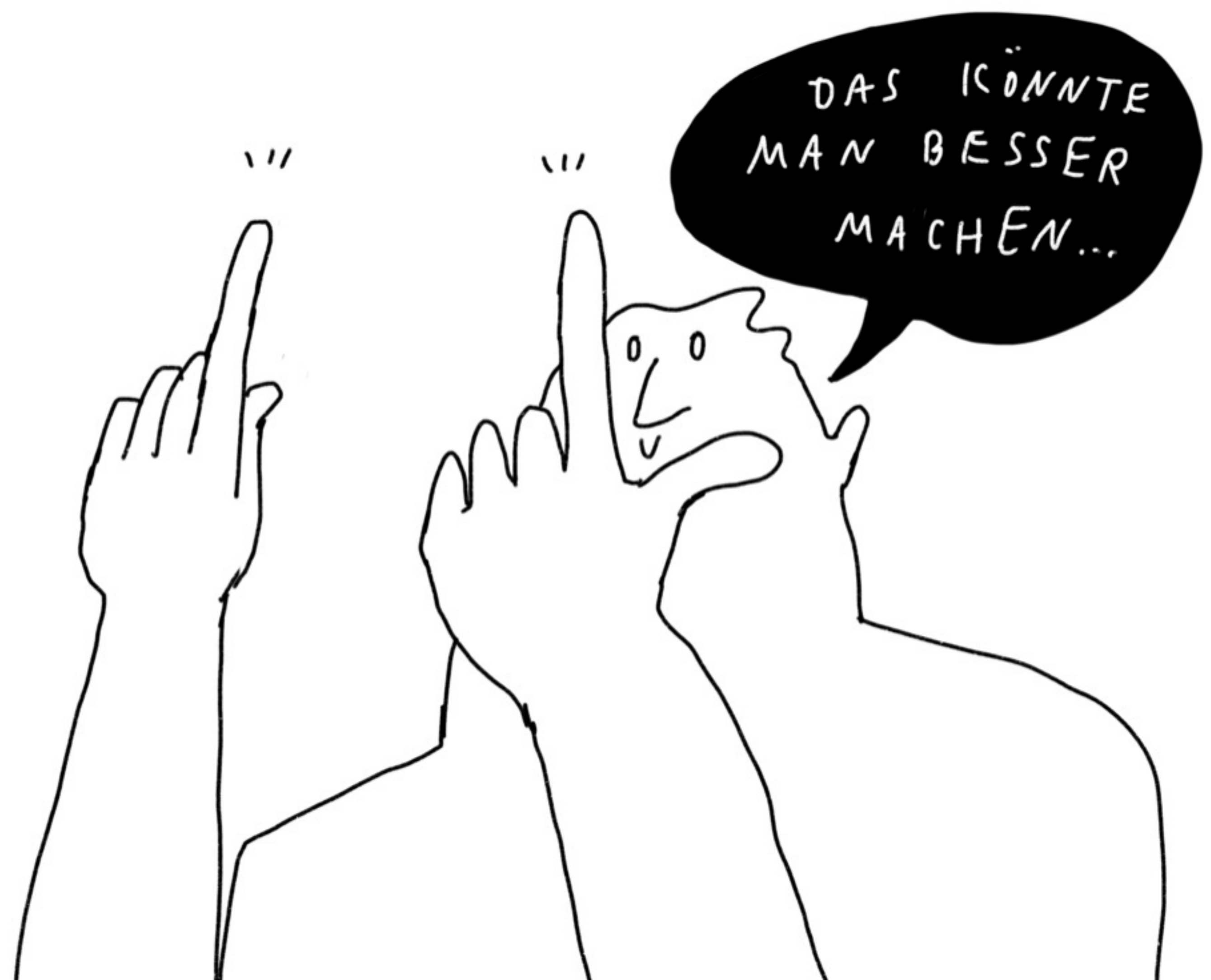
ILLUSTRATION JOHANNA BENZ

DAS IST EIN ARBEITSBLATT AUS DER SERIE RIESENARBEITSBLÄTTER DER JOHN-DEWEY-FORSCHUNGSSTELLE FÜR DIE DIDAKTIK DER DEMOKRATIE