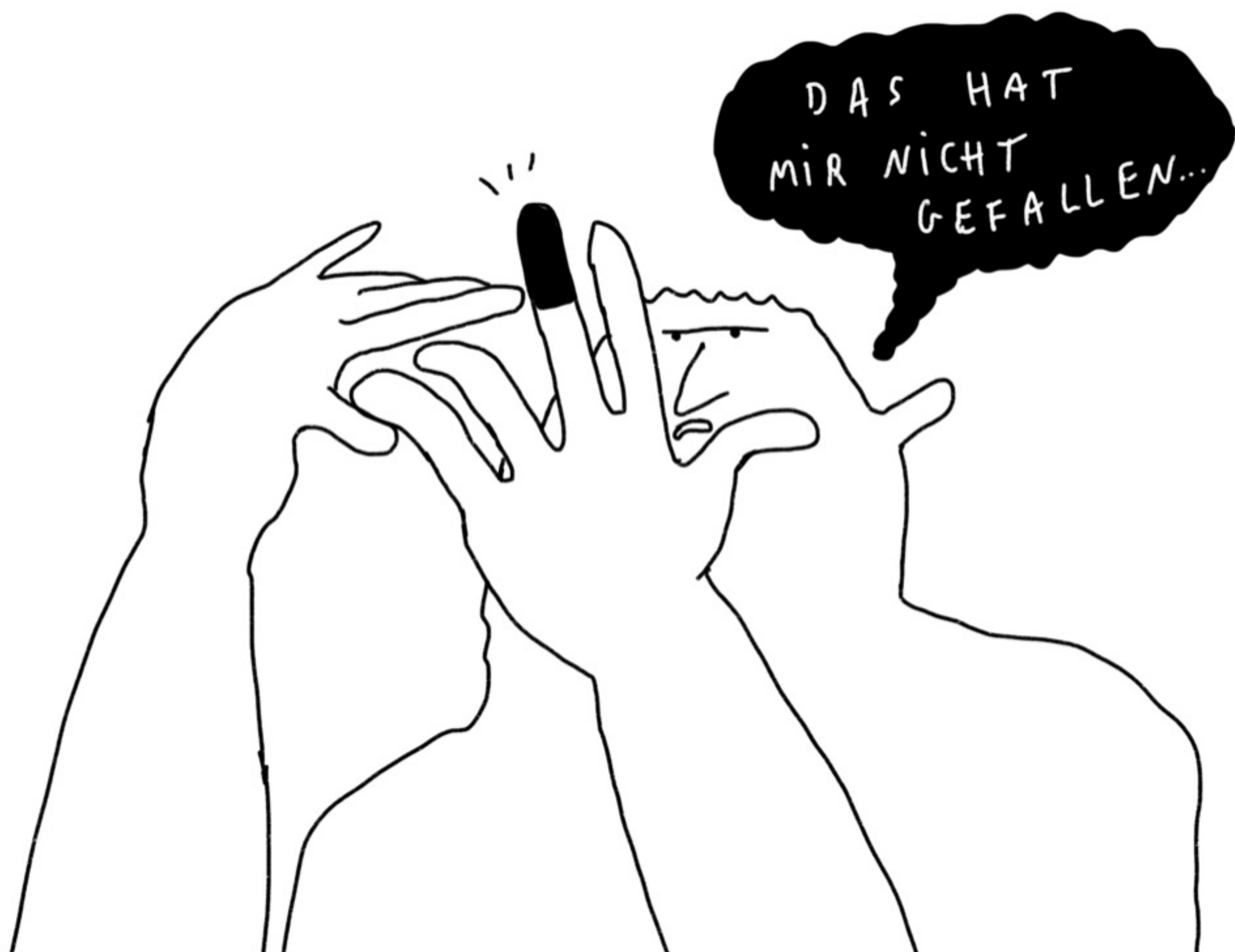
ILLUSTRATION JOHANNA BENZ

DAS IST EIN ARBEITSBLATT AUS DER SERIE RIESENARBEITSBLÄTTER DER JOHN-DEWEY-FORSCHUNGSSTELLE FÜR DIE DIDAKTIK DER DEMOKRATIE