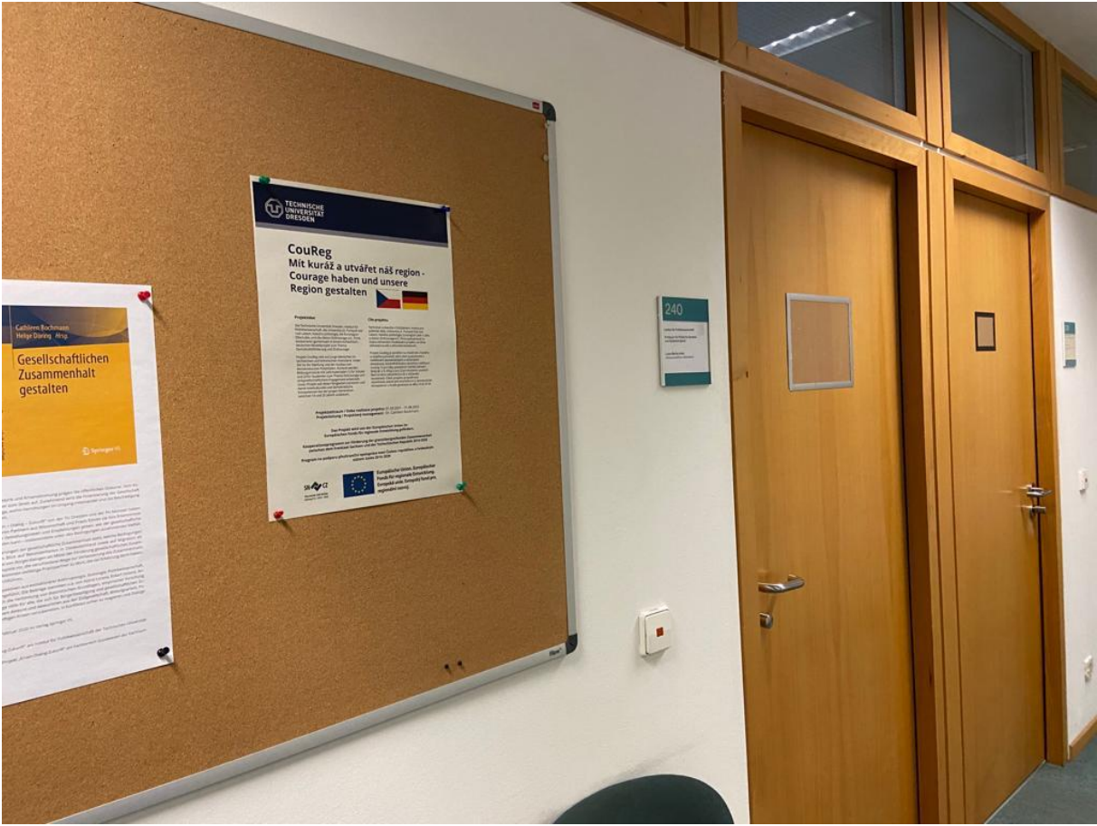
Příloha 3b Fotografie vystaveného informačního plakátu