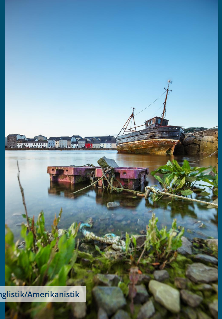
Galway, Irland – Anglistik/Amerikanistik