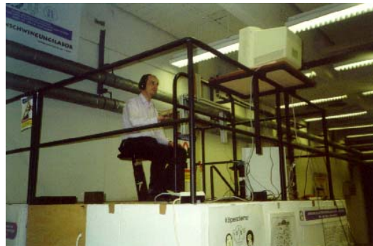
Abb.1: Das Foto der experimentellen Installation

Die Ganzkörperschwingungssignale wurden durch einen elektrohydraulischen Simulator (Schenk) mit einem maximalen Weg (Hub) von 250 Millimetern und einer dynamischen Kraft von 25 kN in der vertikalen Richtung produziert (z-Achse). Ein starrer hölzerner Sitz ohne eine Rückenlehne wurde auf der Simulatorplattform montiert.