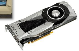
Hardware zur Datenakquisition und -verarbeitung