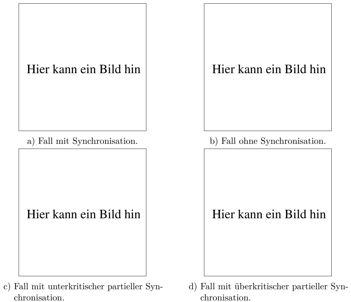
Abbildung 3 – Vier verschiedene Anwendungsfälle für das Hochleistungsschnittstellenboard, die die unterschiedliche Leistungsfähigkeit demonstrieren.

liest, ist selbst schuld. Der Text gibt lediglich den Grauwert der Schrift an. Ist das wirklich so? Ist es gleichgültig, ob ich schreibe: „Dies ist ein Blindtext“ oder „Huardest gefburn“? Kjift – mitnichten! Ein Blindtext bietet mir wichtige Informationen. An ihm messe ich die Lesbarkeit einer Schrift, ihre Anmutung, wie harmonisch die Figuren zueinander stehen und prüfe, wie breit oder schmal sie läuft. Ein Blindtext sollte möglichst viele verschiedene Buchstaben enthalten und in der Originalsprache gesetzt sein. Er muss keinen Sinn ergeben, sollte aber lesbar sein. Fremdsprachige Texte wie „Lorem ipsum“ dienen nicht dem eigentlichen Zweck, da sie eine falsche Anmutung vermitteln.