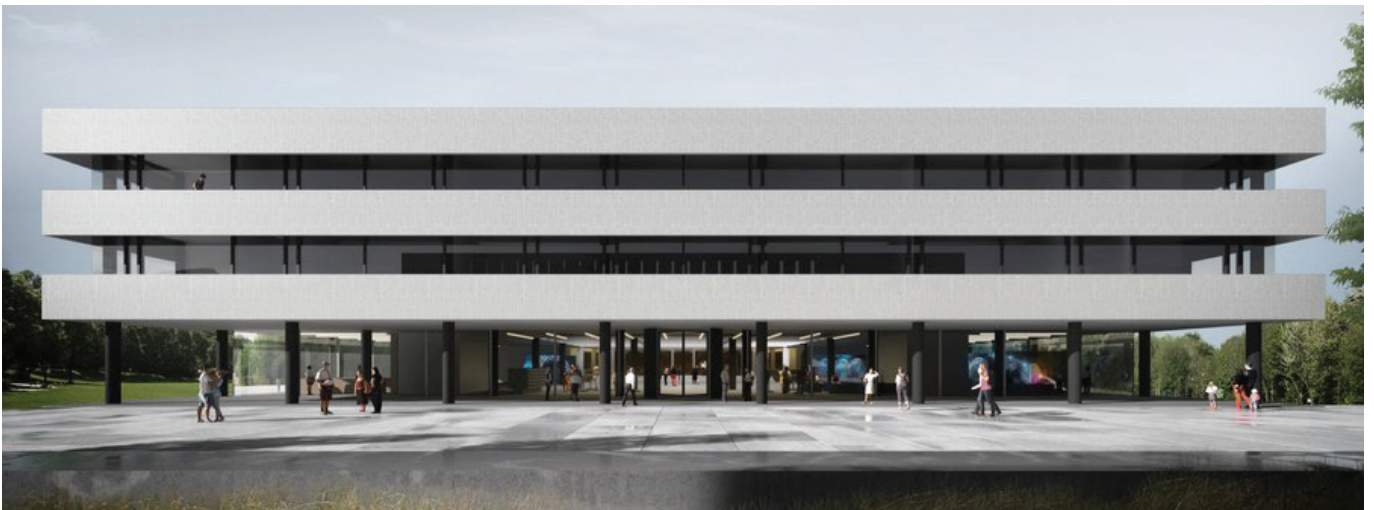
Foto Visualisierung des geplanten Forschungsneubaus für das Lehmann-Zentrum auf dem Campus der TU Dresden © AWB ARCHITEKTEN