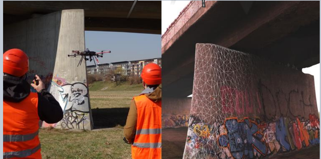
Laservermessung eines Brückenpfeilers durch den Octocopter