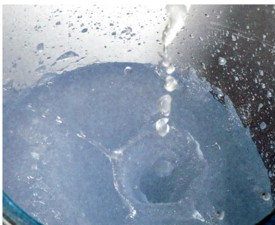
Abbildung: Flüssigeis

Schichten müssten auf eine dickwandige Stahloberfläche aufgebracht werden können, in einer Grobvakuumatmosphäre (6 mbar) dauerhaft beständig sein sowie den mechanischen Belastungen durch das entlangströmende, gerührte Eis-Wasser-Gemisch standhalten.