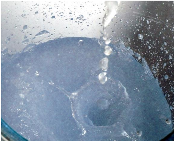
Abbildung: Flüssigeis

Schichten müssten auf eine dickwandige Stahloberfläche aufgebracht werden können, in einer Grobvakuumatmosphäre (6 mbar) dauerhaft beständig sein sowie den mechanischen Belastungen durch das entlangströmende, gerührte Eis-Wasser-Gemisch standhalten.