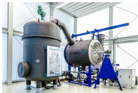
Abbildung: Pilotanlage zur Kältespeicherung mit Flüssigeis an der Westsächsischen Hochschule Zwickau

Es gibt auch Anwendungen, die auf die Entstehung und nicht auf die Vermeidung von Eis abzielen. Eis wird aufgrund seiner Temperatur und hohen Schmelzwärme seit langem als Kältespeicher eingesetzt und gewinnt mit der Energiewende an Bedeutung. Eis eignet sich hervorragend, um in Kühl- und Klimatisierungsanwendungen fluktuierend bereitgestellten Strom als Nutzenergie in thermischer Form zu speichern. Damit kann sowohl die elektrische Spitzenlast gesenkt als auch die Kälteerzeugung in Zeiträume verlagert werden, in denen preiswerter bzw. "überschüssiger" regenerativer Strom verfügbar ist.