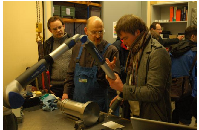
Studenten und Meister bei der Erläuterung der Messtechnik

Mit Unterstützung unserer Industriepartner werden zu fast allen Lehrveranstaltungen ergänzende Exkursionen angeboten. Im Rahmen der Vorlesung Fluidarbeitsmaschinen konnte im vergangenen Wintersemester die Firma BORSIG ZM Compression GmbH in Meerane besucht werden.