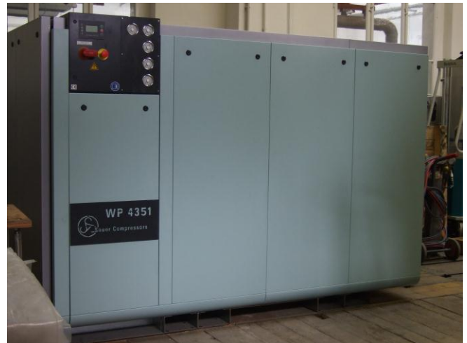
Der neue Helium-Kompressor von Sauer & Sohn

Voraussichtlich noch in diesem April wird die zentrale Helium-Verflüssigungsanlage der TU Dresden durch die Inbetriebnahme eines weiteren Kompressors ergänzt. Die von PD Christoph Haberstroh betreute Anlage stellt als offizielle zentrale Einrichtung die Flüssigheliumversorgung für die physikalischen und chemischen Institute der TU Dresden sicher. Zudem werden einige externe Forschungseinrichtungen in der Versorgung unterstützt.