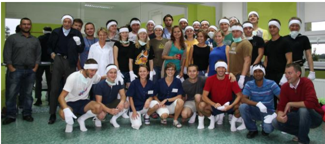
Teilnehmer des European Course of Cryogenics 2011 beim Besuch der Cryochamber in Wroclaw, Polen