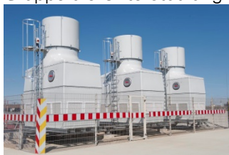
Kühltürme Airport Bremen

Die Cofely Refrigeration versteht sich als ganzheitlicher Kältepartner und ist auf alle Belange rund um wirtschaftliche und energieeffiziente Kältesysteme spezialisiert. Zum Produkt- und Dienstleistungsprogramm gehört das Projektieren, Fertigen, Betreiben und Betreuen von Kältesystemen und deren Komponenten. Das Unternehmen mit Hauptsitz in Lindau am Bodensee verfügt über ein flächendeckendes Vertriebs- und Servicenetz in Deutschland und hat als Teil der internationalen GDF SUEZ-Gruppe die Unterstützung eines Weltkonzerns.