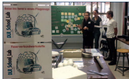
Der ILK-Versuchsstand im Schülerlabor.