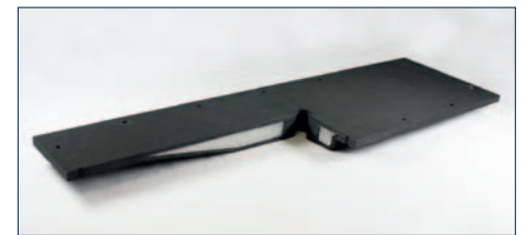
Neuartiges CFK-Sandwich-Panel für den Airbus A350.

Die Elbe Flugzeugwerke GmbH (EFW) und die Leichtbau-Zentrum Sachsen GmbH (LZS) haben in der Rekordzeit von nur zwei Jahren eine ganze Bauteilfamilie für die Bodenstruktur des neuen Airbus A350 entwickelt. Die hochbelastbaren CFK-Sandwich-Panels setzten sich in der Entwicklung gegen metallische Strukturen aus Aluminium bzw. Titan durch und befinden sich derzeit in der anspruchsvollen Validierungs- und Zulassungsphase bei Airbus. Die Bauteile werden zukünftig bei