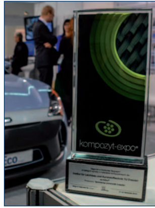
Erster Preis für den InEco auf der Fachmesse „Kompozyt-Expo“ in Krakau/Polen.

Auf der Fachmesse „Kompozyt-Expo“ im polnischen Krakau, die jährlich neuartige Produkte und Innovationen im Bereich der Faserverbunde präsentiert, erhielt der InEco in der Kategorie Faserverbunderzeugnisse den ersten Preis. Ausgezeichnet wurde nicht nur die innovative CFK-Stahl-Hybridbauweise, sondern vor allem die gelungene Funktionsintegration im Fahrzeug. Die Kommission war beeindruckt von der Originalität und Funktionalität des Projektfahrzeuges. Neben dem generischen Fahrzeug stellten die Dresdner Leichtbauforscher auf beiden Messen den Karosserierohbau und weitere im Projekt entstandene Exponate vor.