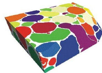
Abb. 1: oben: Tomogramm eines Aluminiumschaums, unten: segmentierte Poren