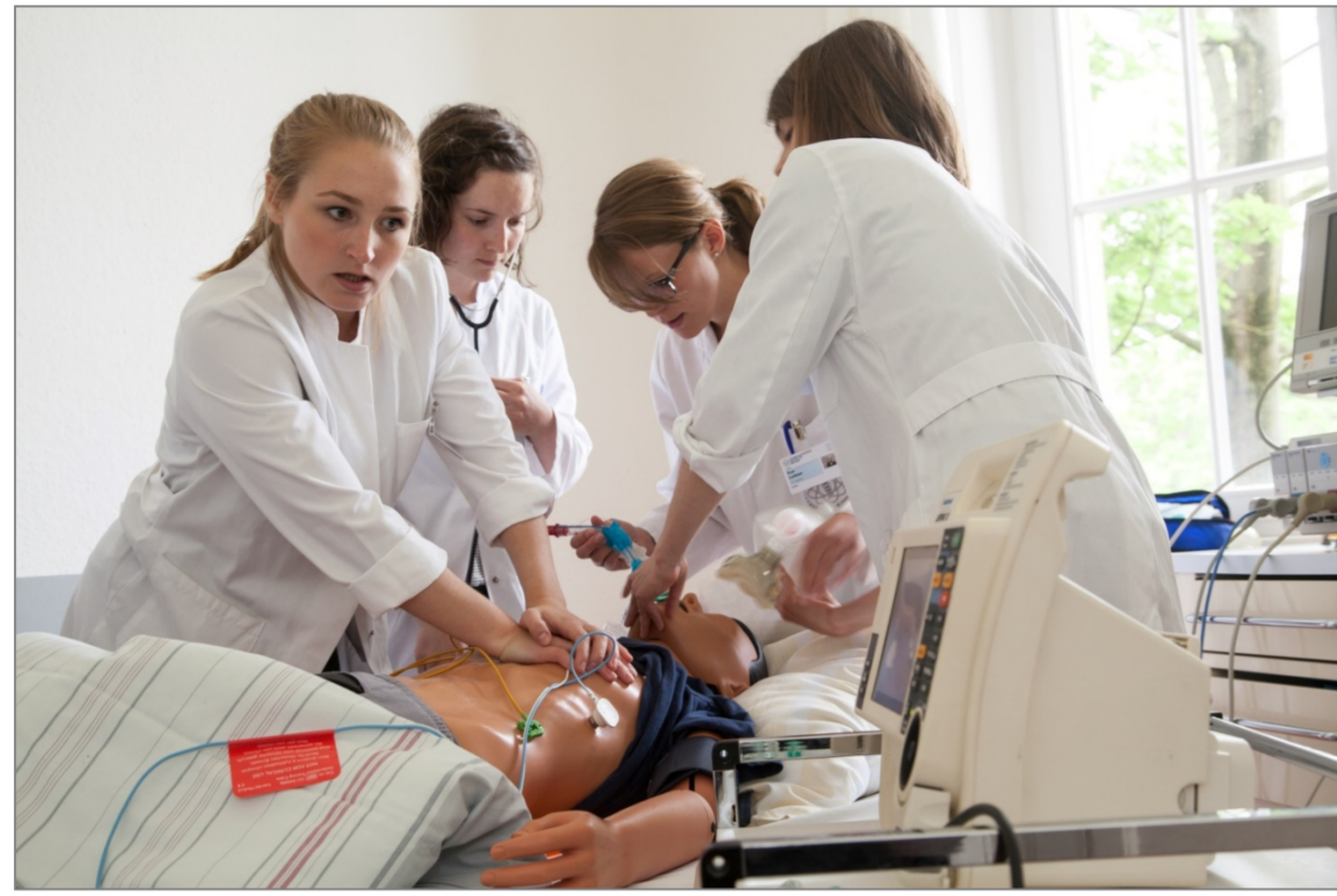
Teilnehmerinnen bei einer Reanimationsübung im Rahmen des PJ-WarmUp (Vorbereitungskurs auf das Praktische Jahr)