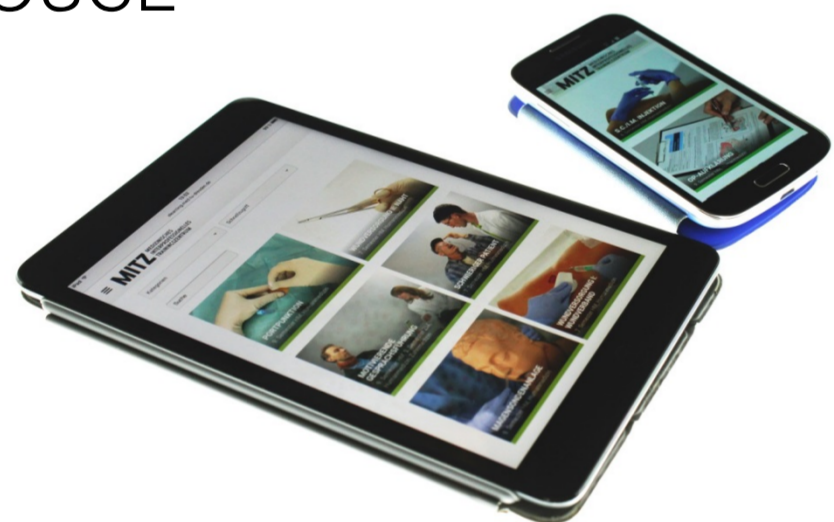
www.mitz-mobil.de auf mobilen Endgeräten