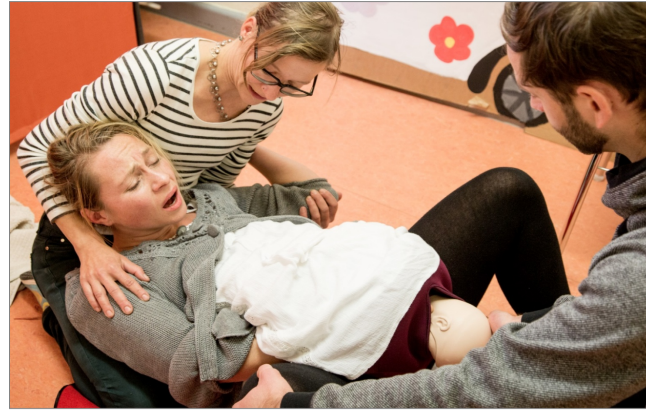
Teilnehmer/in und Schauspielpatientin bei einem praktischen Training zum Thema „Geburt“