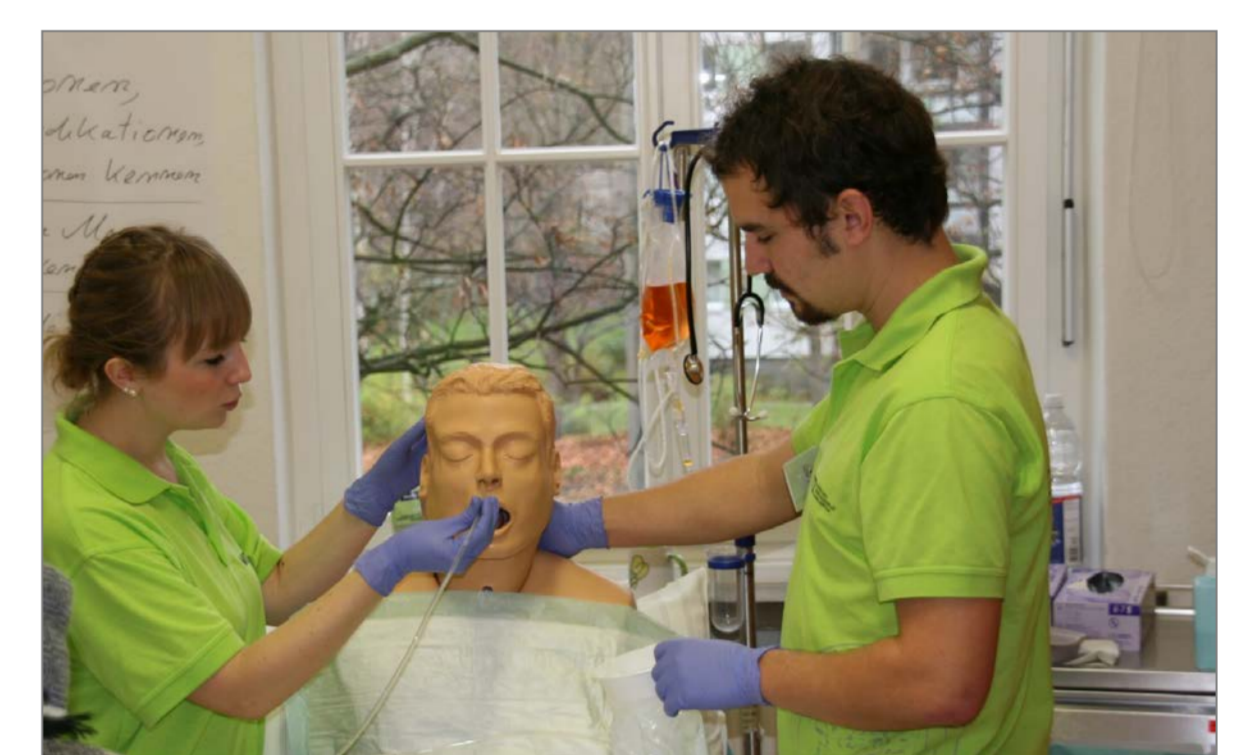
Studentischer Tutor und pflegerische Tutorin in einer interprofessionellen Lehreinheit