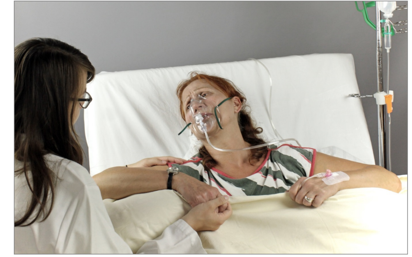
Kommunikationstraining mit Schauspielpatientin zum Thema „Palliativmedizin“