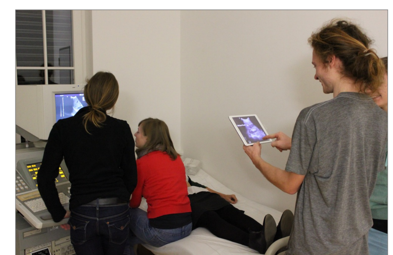
Teilnehmer/innen des Ultraschall-Workshops