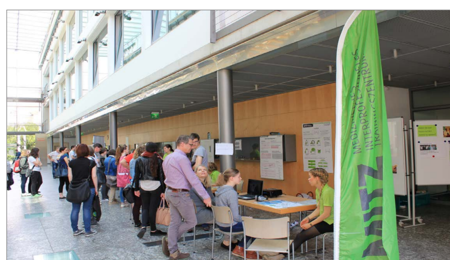
Der MITZ-Stand im Rahmen von UNI-Live