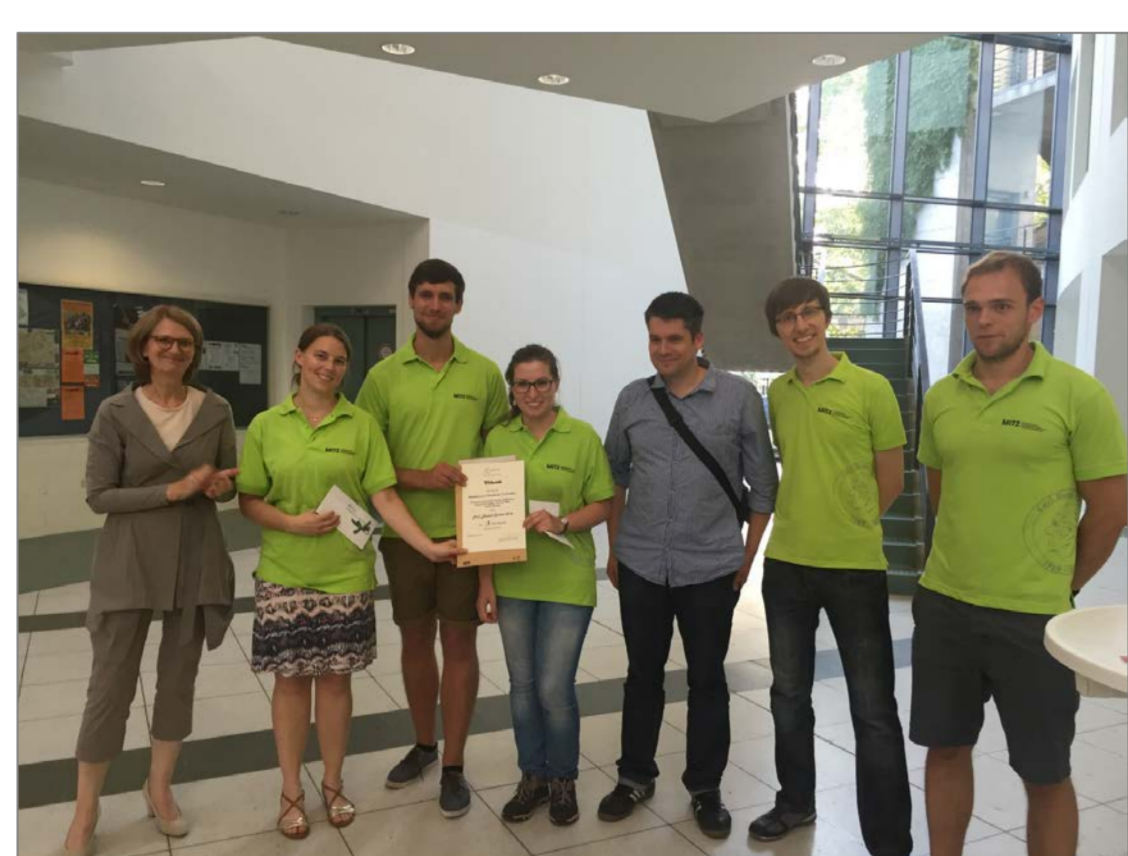
Das Team der Medizinischen Fakultät erreichte beim Paul-Ehrlich-Contest 2016 in Berlin den 3. Platz