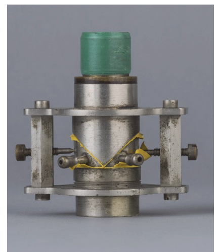
Polsterpfeife nach Wethlo zur Demonstration der Stimmerzeugung, 1913

Ein herausgehobenes Ziel des Projektes ist es, diese Sammlung für größere Nutzergruppen sichtbar und nutzbar zu machen. Anhand innovativer Technologien zur multimedialen Erschließung und interaktiven Simulation der Exponate soll diese Zielstellung letztlich erreicht