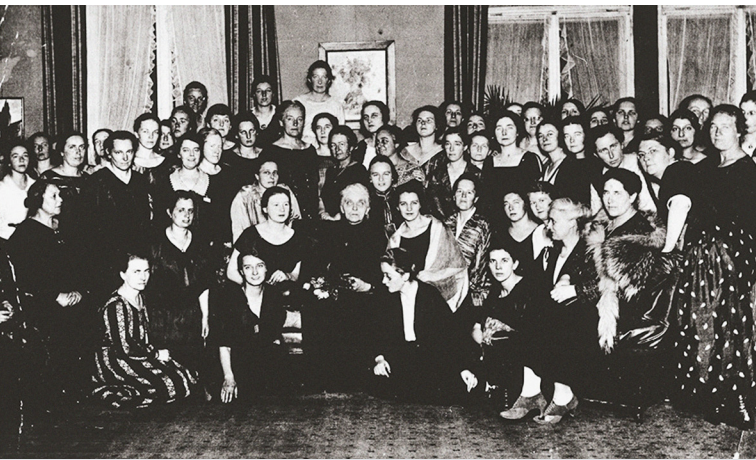
Gründungsversammlung des „Bundes Deutscher Ärztinnen“, Berlin 1924