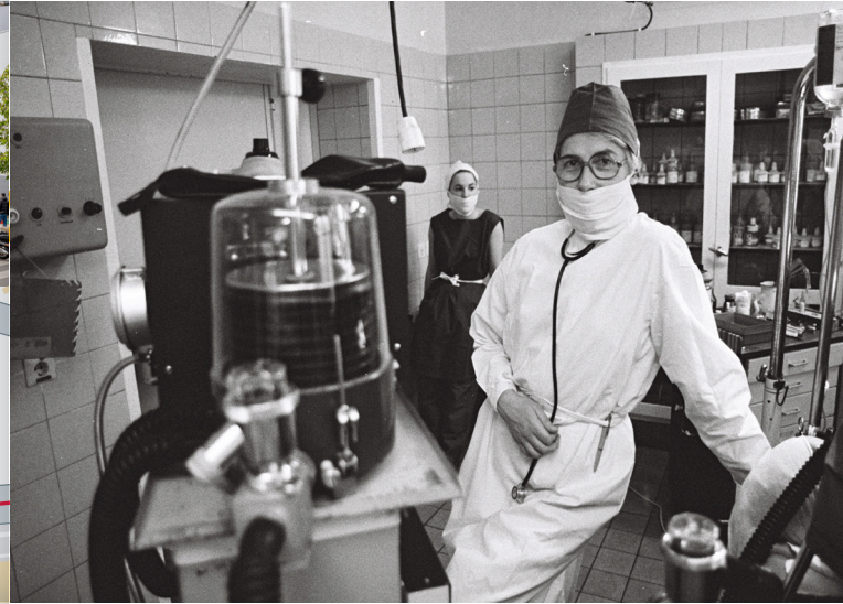
Bild Titelseite: Signatur: 1770-2A-TH26-LEA