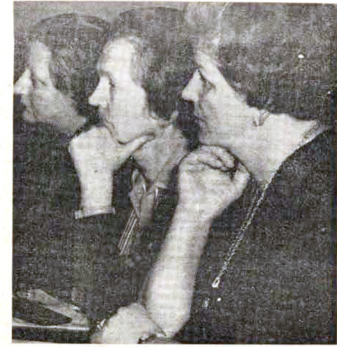
Bericht des „Akademie-Echo“ der Medizinischen Akademie Dresden, Februar 1965