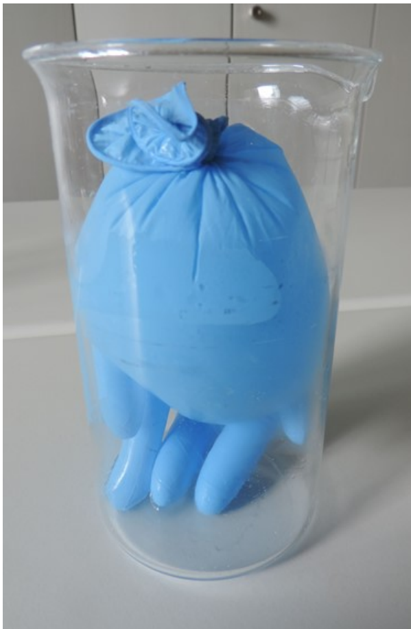
Abb. 1: befüllter verknoteter Handschuh