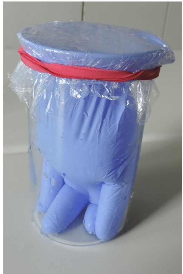
Abb.2: befüllter über ein Becherglas gestülpter Handschuh, abgedeckt