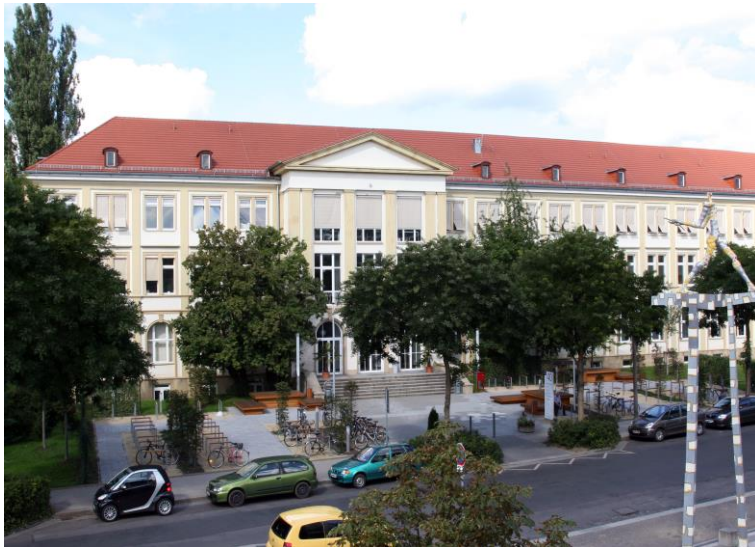
TUD, Medizinische Fakultät