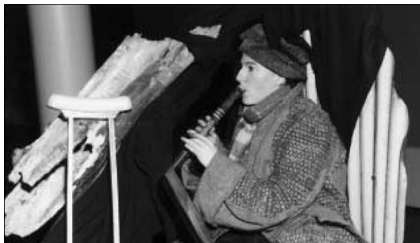
Die Solisten agierten lebendig und mit Engagement.