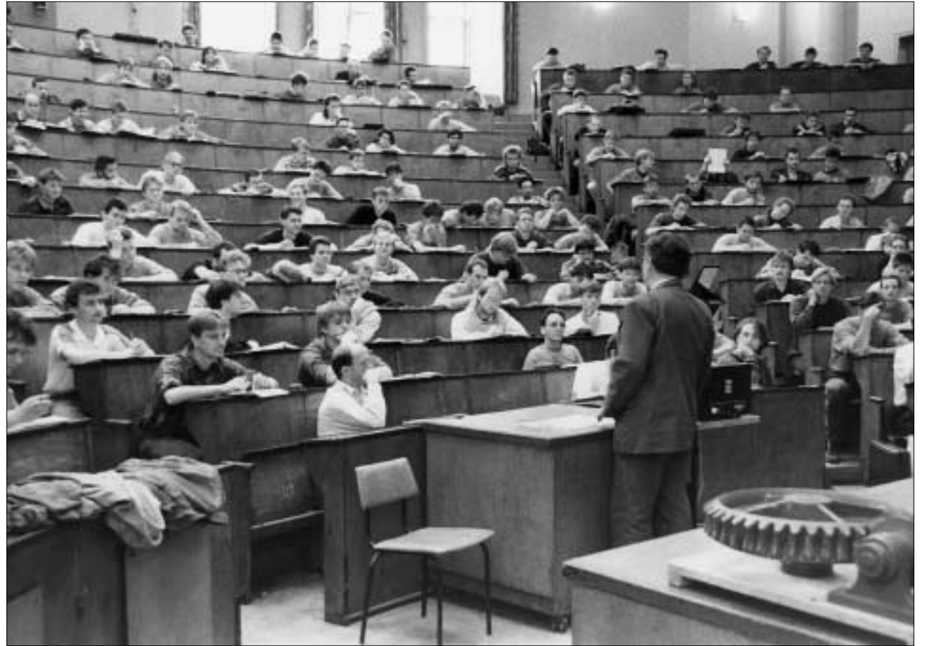
Die universitäre Bildung: Ein intensiver Teil lebenslangen Lernens.

Die TU Dresden strebt eine kontinuierliche Erhöhung der Qualität der Lehre an. Sie verfolgt dieses Ziel insbesondere durch Sicherung und Ausbau der materiellen Voraussetzungen für die Durchführung der Lehre und durch ein geeignetes Spektrum von Formen der Evaluation der Lehre. Die TU Dresden wird ihre Leistungsdominanz aber auch an der Ausprägung international