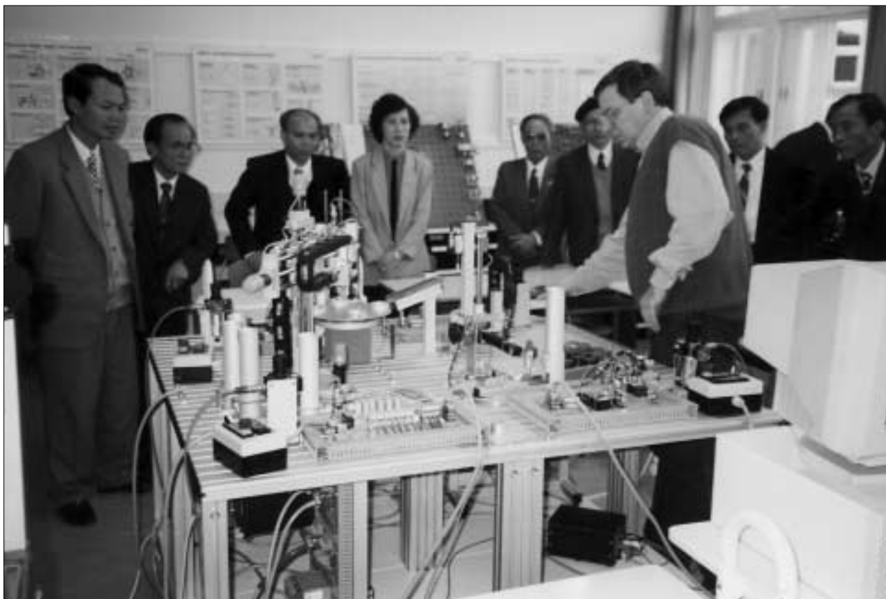
Auch an der Fakultät Erziehungswissenschaften der TU Dresden: Die von der Industrie- und Handelskammer (IHK) Dresden organisierte und betreute Delegation vietnamesischer Berufsbildungsexperten.

Fakultät Erziehungswissenschaften: Veranstaltung stellte Studienmöglichkeiten vor