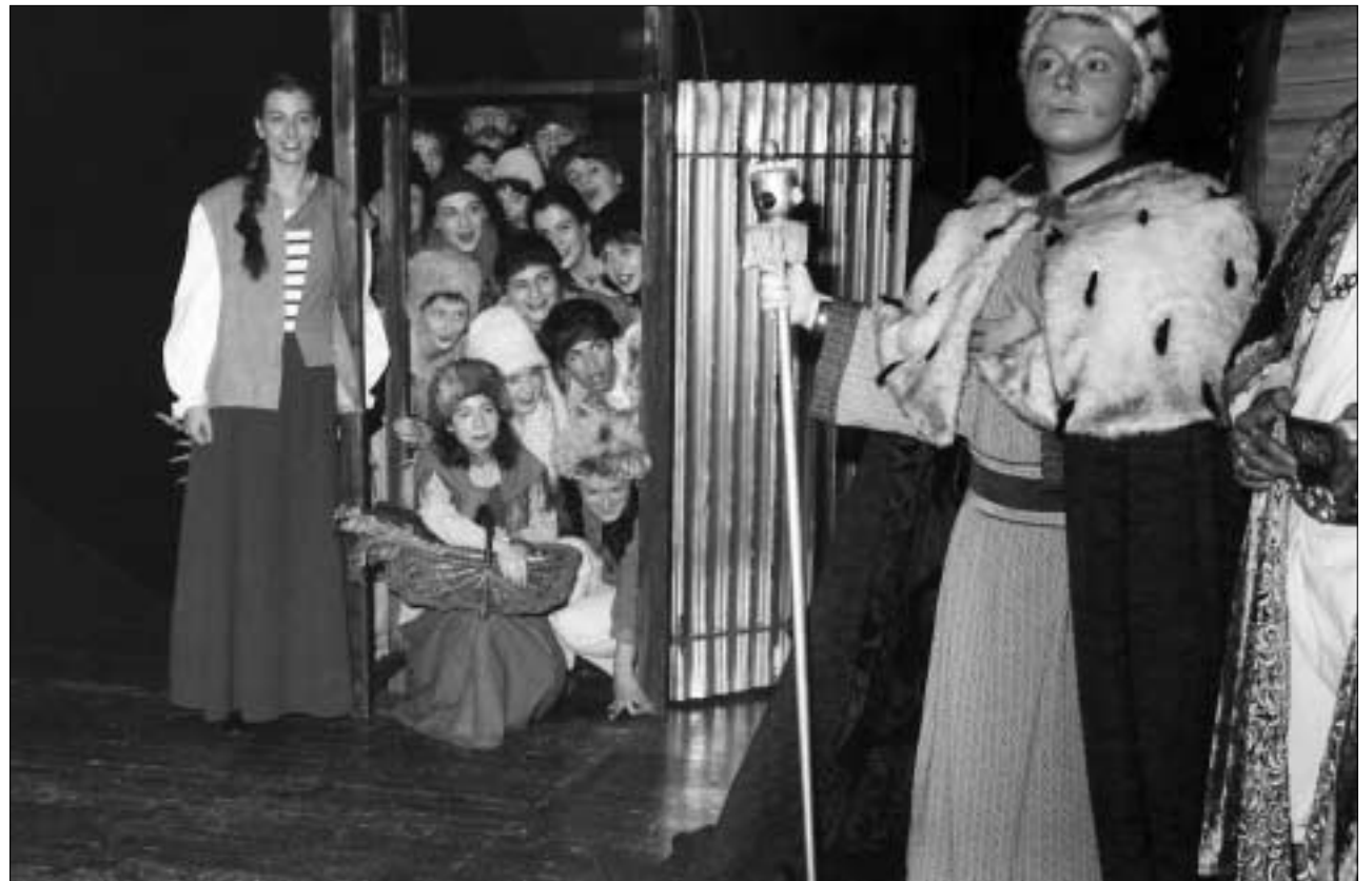
Märchenhaft und ein wenig dem hierzulande beliebten Krippenspiel verwandt ist die Handlung vom kleinen verkrüppelten Hirtenjungen, der den Besuch der Heiligen Drei Könige erlebt und ihnen nach dem Wunder seiner Heilung folgt.

„Amahl und die nächtlichen Besucher“, Weihnachtsoper in einem Akt von G. C. Menotti, wurde 1951 im amerikanischen Fernsehen uraufgeführt – für Kinder. Entsprechend märchenhaft und ein wenig dem hierzulande beliebten Krippenspiel verwandt ist die Handlung vom kleinen verkrüppelten Hirtenjungen, der den Besuch der Heiligen Drei Könige erlebt und ihnen nach dem Wunder seiner Heilung folgt. Die Musik Menottis ist leicht verständlich, jedoch nicht ohne Anspruch an den