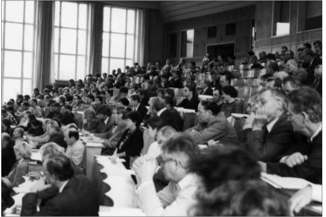
Die 6. Sitzung des Konzils der TU Dresden: Der Heinz-Schönfeld-Saal (Barkhausen-Bau) war gut gefüllt, eine große Zahl von Rednern griff zum Diskussionsmikrofon.

6. Sitzung des Konzils der TU Dresden fand am 18. Dezember statt