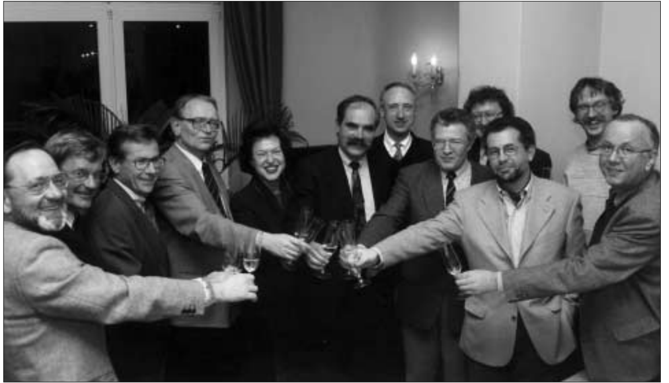
Die „Macher“ des neuen Sonderforschungsbereiches im Konvivialium.