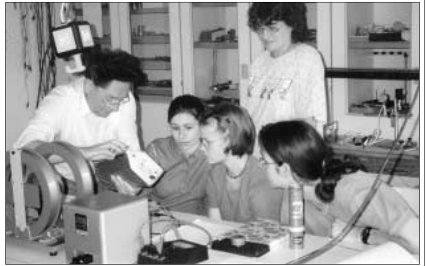
In zwei mehrstündigen Veranstaltungen bearbeitete jeder Schüler unter Aufsicht der Mitarbeiter der Professur vier Experimentierkomplexe.

Die Durchführung aller Experimente brachte für die Schüler einen hohen Gewinn. Sie konnten mit Geräten arbeiten, die an ihrer Schule nicht vorhanden sind und bei den zu bearbeitenden Aufgaben zeigen, dass ihr Verständnis für Phänomene der Elektrizitätslehre gewachsen ist. Christel Kutter