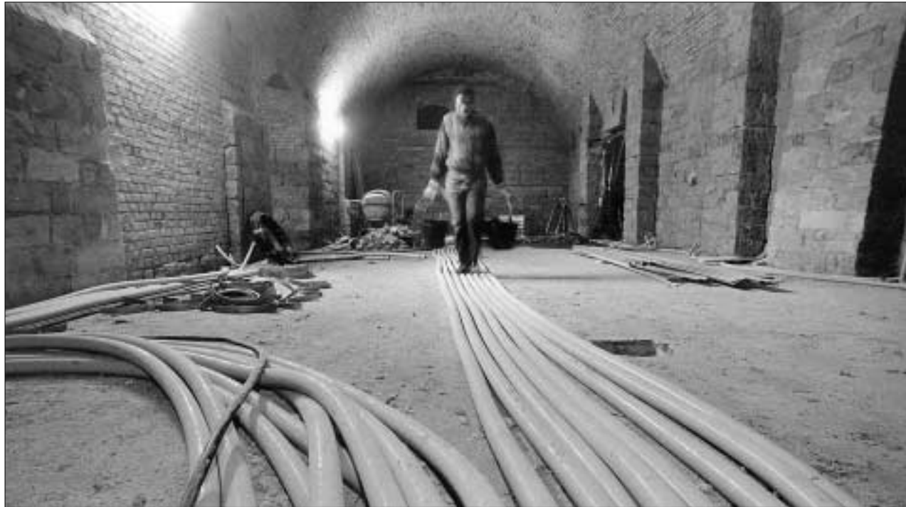
Der vom Freistaat Sachsen mit Nachdruck betriebene Umzug des Jazzclubs „Tonne“ 1997 vom Stadtzentrum ins Waldschlösschengelände – hier ein Schnappschuss vom Bauzustand der neuen Räumlichkeiten Anfang 1997 – war bei den Vereinsmitgliedern umstritten. Er sei die einzige Chance für den Jazzclub überhaupt, da ein Verbleib in der zum Verkauf ste-

In Dresden werden dabei der Verein riesa efa, die Kümmelschänke und die