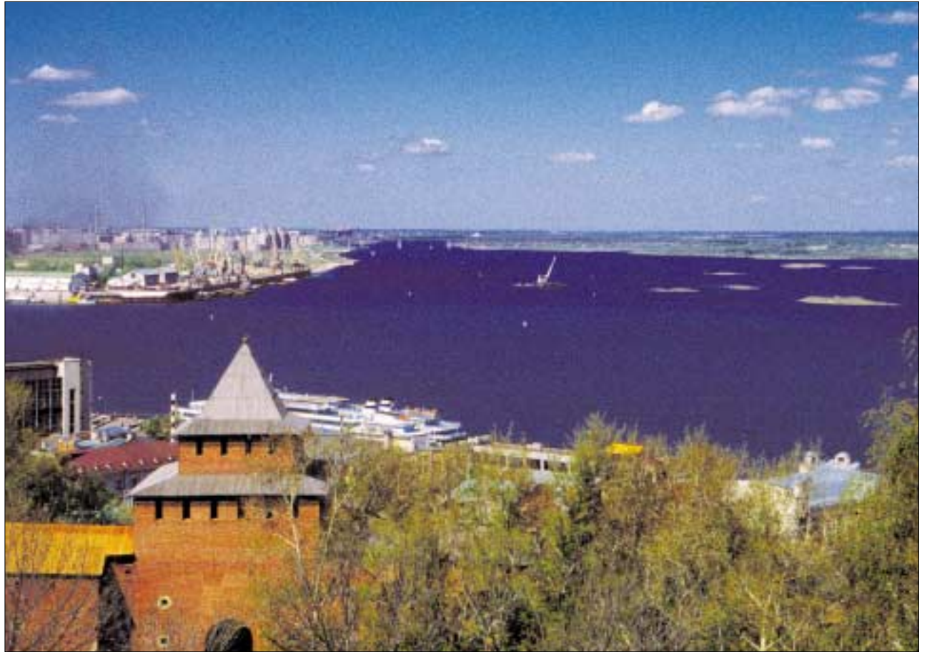
Nishnij Nowgorod: Blick vom Kreml.

In dem aus dem 16. Jahrhundert stammenden Kloster Ipatovsk richtete sich die Aufmerksamkeit auf die restaurierten Fresken in der Kirche und eine im Klosterhof aufgestellte Holzkirche aus dem Überflutungsgebiet eines der Wolgastauseen.