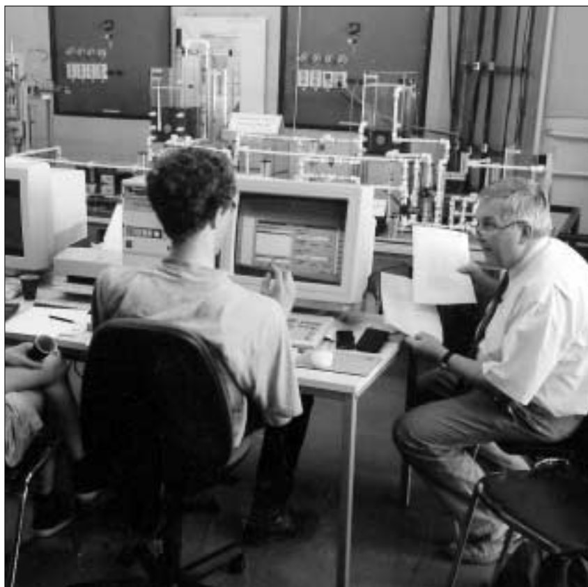
Auch mittels Computersimulation gelingt die Erfassung der Prozessrealität einer komplexen Industrieanlage nur teilweise.

Erste Ergebnisse dieser Forschung wurden auf einem Symposium über Instruktionsdesign auf der 8th European Conference for Research on Learning and Instruction in Göteborg/Schweden