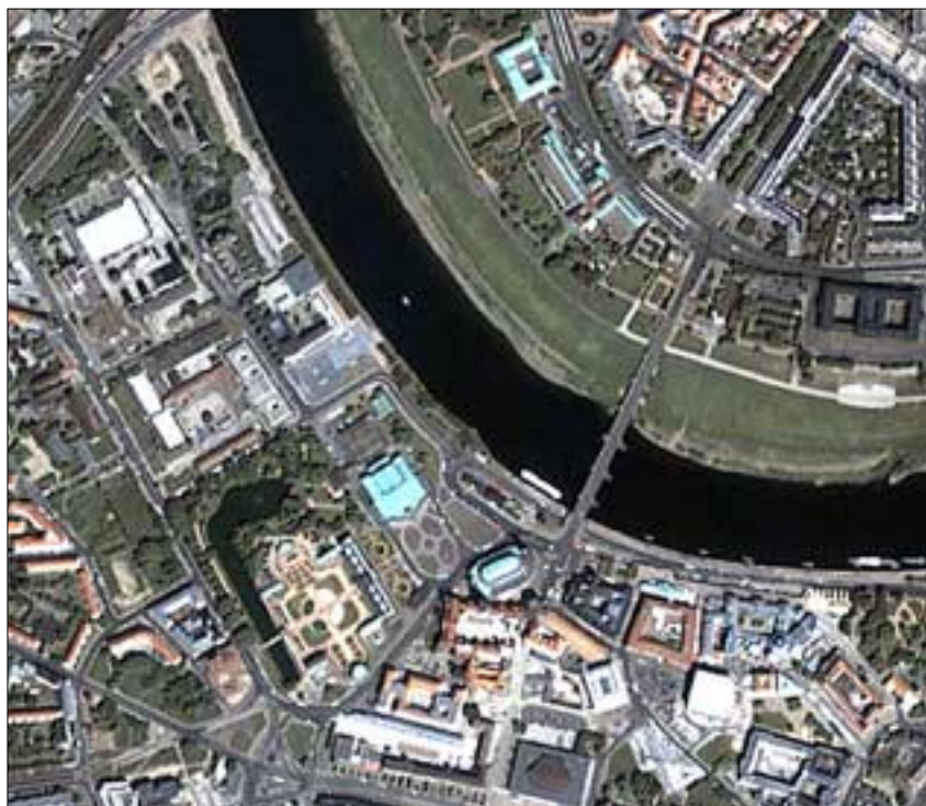
Der Satellit ermöglicht Detailinformationen, die bisher dem Luftbild vorbehalten waren – hier Bild von Dresden.