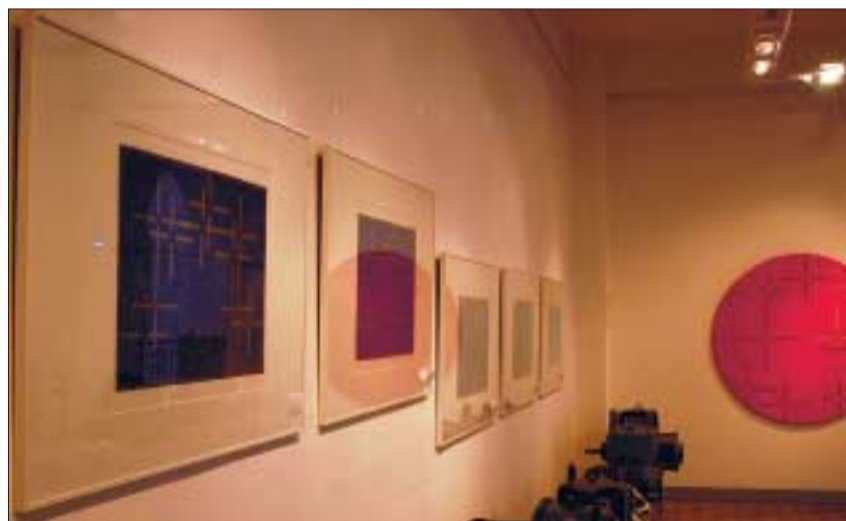
Präsentationspremiere der Folge »a roma - nach(t)spiele«, 2000, von Shizuko Yoshikawa. Hier während des Ausstellungsaufbaus.

»POESIE+RATIO«; Universitätssammlungen.Kunst+Technik der TU Dresden. Görges-Bau, Elektrotechnisches Institut, Helmholtzstraße 9, 01062 Dresden www.tu-dresden.de/kunst-plus-technik Öffnungszeiten: Mo.–Sa. 10 bis 18 Uhr Führungsanmeldungen: Tel.: 0351 463-39596 oder 39461 Fax.: 0351 463-39479 Gabriele Jacob/Kerstin Franke-Gneuß E-Mail: Weidauer@eti.etu.tu-dresden.de