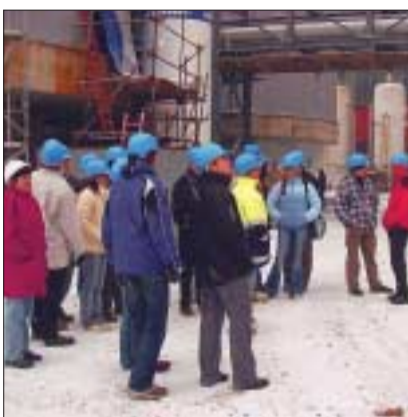
Blick zum Nachbarn: Verfahrenstechnik-Studenten besuchten die Luftzerlegungsanlage in Vresova.

Durch die Vorträge einschließlich der Exkursion erhalten die Studenten einen umfassenden Überblick über die Struktur eines Anlagenbaubetriebes und über die wesentlichen Schritte zu Planung, Bau und Montage einer verfahrenstechnischen Großanlage. Die spezifischen Fachvorträge, gehalten von Linde-Mitarbeitern der unterschiedlichen Abteilungen, vermitteln den Studenten sehr anschaulich den komplexen Entstehungsprozess einer technischen Anlage. Angefangen vom Verfahrensfließbild bis hin zu den Aufgaben des Bauleiters lernen die Studenten die Entstehung einer Anlage kennen und erhalten