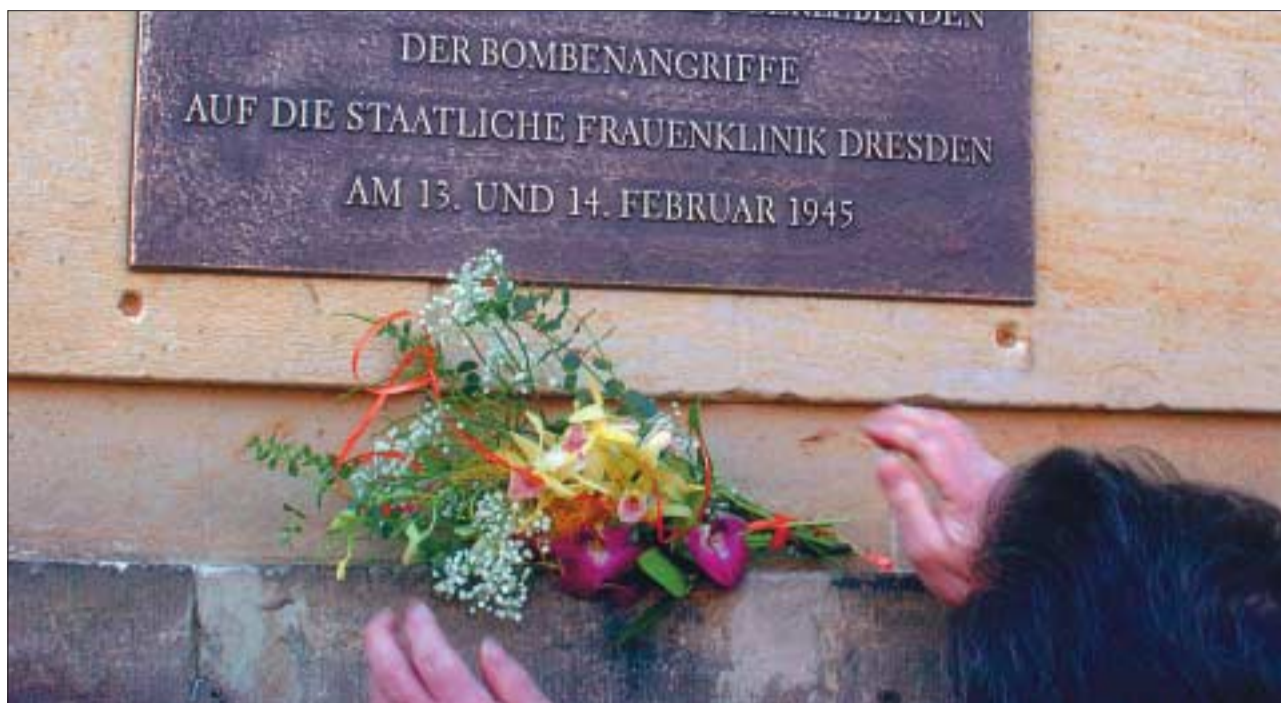
Nun erinnert eine Gedenktafel an die Toten und Überlebenden des Bombenangriffs vom 13. Februar 1945, an dem auch die Frauenklinik Dresden-Johannstadt zerstört wurde.