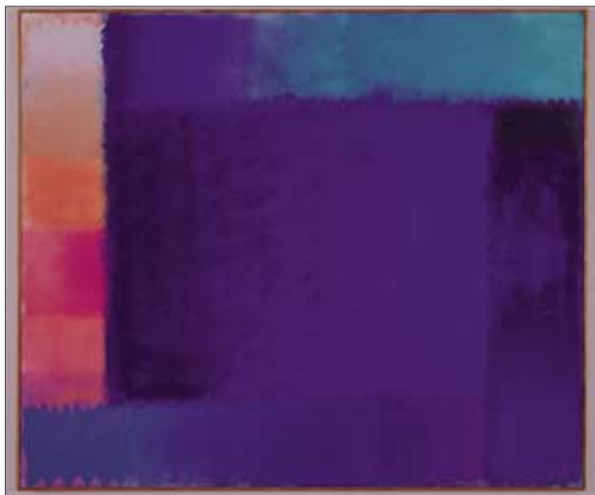
Heinz Mack: Vier Horizonte. 2002. Chromatische Konstellation, Acryl auf Leinwand, 110X130