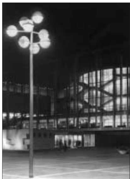
Werner Ruhnau: Musiktheater Gelsenkirchen, 1959.