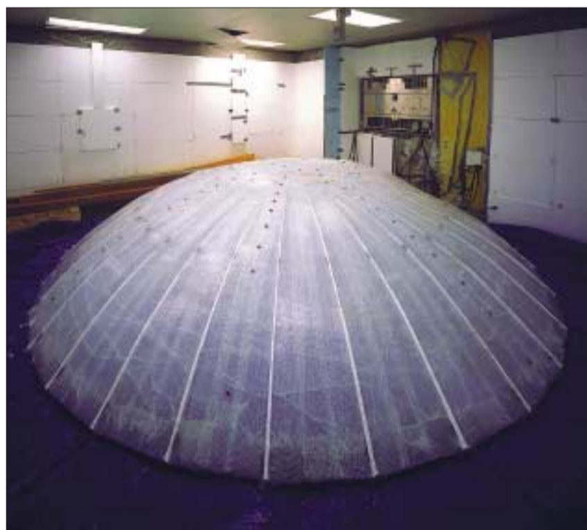
Textilverstärkte Eiskuppel im Kältelabor an der TU Wien.