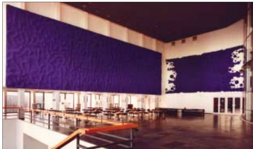
Yves Klein: Schwammreliefs, 1959, Foyer Musiktheater Gelsenkirchen.

Mittwoch, 2. März 2005, 19 Uhr, im Hörsaalzentrum, Bergstraße 64, Hörsaal 04 Eine Produktion des AVMZ in Zusammenarbeit mit dem Institut für Kartographie der TU Dresden.