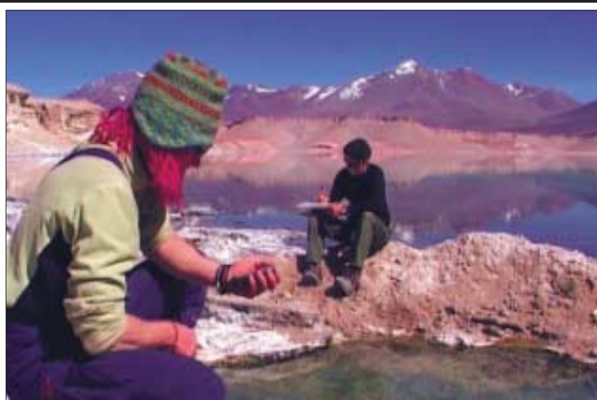
Die Arbeit in der Atacama-Wüste ist entbehrungsreich.