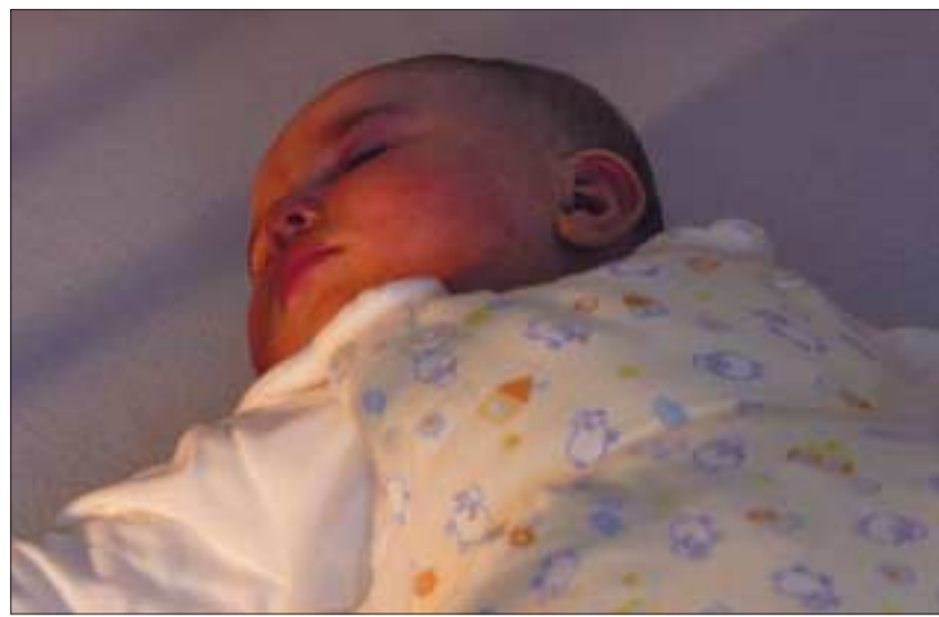
Babys schlafen am sichersten in Rückenlage, im Schlafsack ohne zusätzliche Überdeckung, im eigenen Bettchen im Schlafzimmer der Eltern und in einer rauchfreien Umgebung bei 16 bis 18 Grad.

Diese Beobachtungen bestätigen, dass manche Babys einen raschen Temperatur-