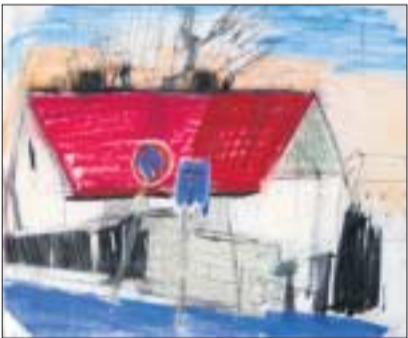
Haus in Neuimptsch. Bild: Steffi Köhler

Die Bilder der 22-jährigen Dresdnerin sind in den Räumen der HNO-Allergieambulanz (2. Obergeschoss von Haus 5 des Uniklinikums) zu sehen. H.O.