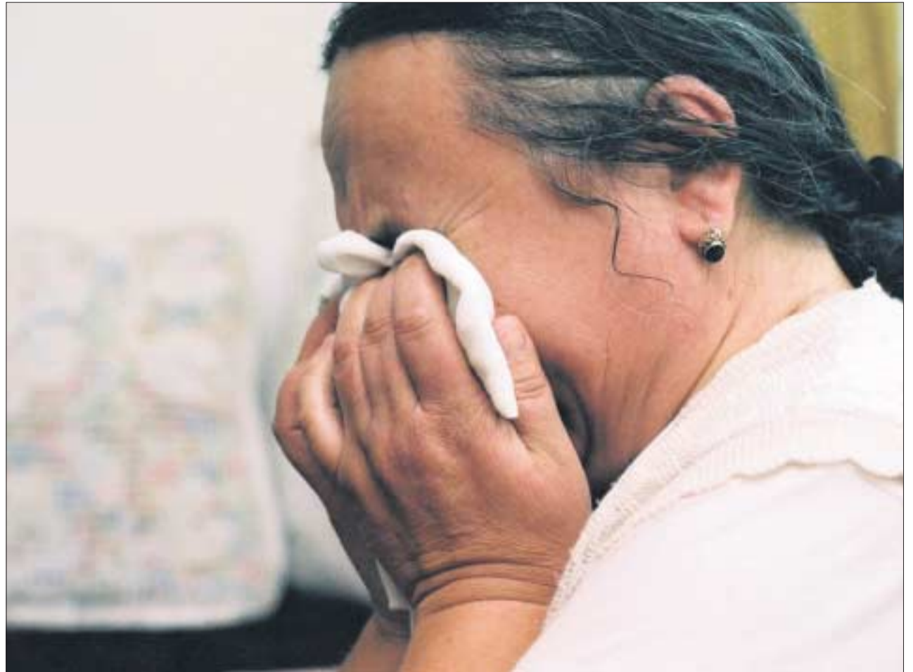
Anfang der 1990er Jahre wurden in den Kriegen auf dem Balkan Zehntausende Frauen und Mädchen vergewaltigt, wie diese traumatisierte Frau aus Bosnien, die durch das Projekt »Medica Zenica« betreut wird.

Der entscheidende Anstoß für die Entwicklung des Völkerstrafrechtes zu sexueller Gewalt in den 1990er Jahren war zweifellos