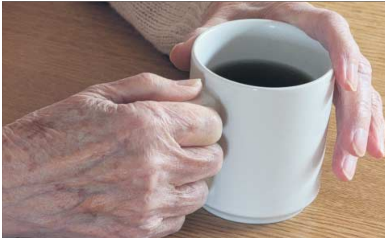
Das Projekt Generationengespräche bietet weit mehr als nur die einseitige Vermittlung der Erfahrungen Älterer an junge Menschen. Jugendliche berichten ebenso von sich, und ein gemeinsames Sportfest rundet das Projekt ab.