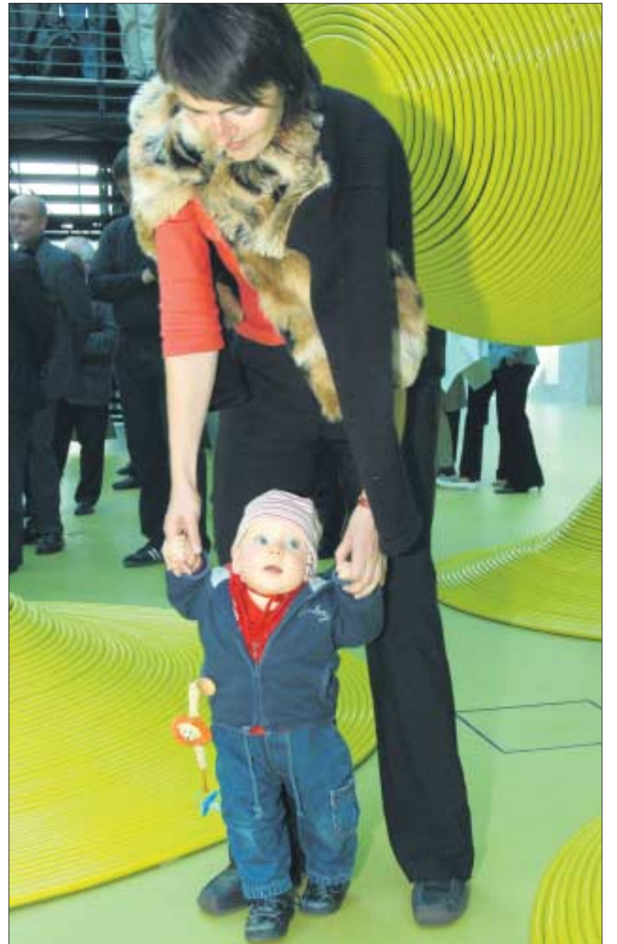
Eine junge Mutti zeigt ihrem Sprössling die TU. Sollte sie in seinen ersten Lebensjahren im Job pausieren oder ihn fremd betreuen lassen?

Da ist es doch überraschend, dass die Frauenerwerbsquote in Deutschland in etwa so hoch ist wie in Frankreich.