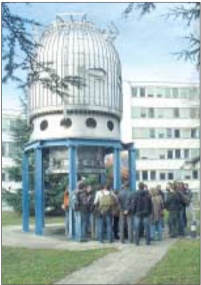
Eine Gruppe von Studenten vor einer historischen Blasenkammer, die bis 1984 in Betrieb war.

Um diese letzte Möglichkeit einer Besichtigung zu nutzen, organisierten Prof.