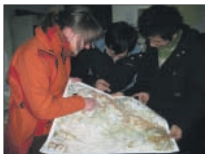
Die extra eingeschickte Wanderkarte der Sächsischen Schweiz.