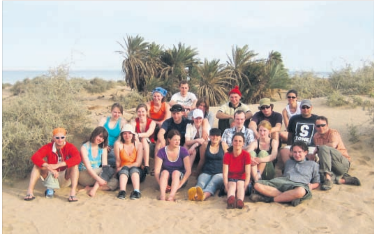
Die Expeditionsteilnehmer in den Wüstendünen des Nationalparks Nabq.

Man könnte annehmen, dass es ermüdet, täglich die gleiche Wüste mit denselben Bergen im Hintergrund zu sehen, doch dies war nicht der Fall. Denn, wenn man genau hinschaut, entdeckt man schnell, dass dort nichts gleich ist. Das Gebirge zeigt sich in den schönsten Farben und hat im Laufe der Zeit die skurrilsten Formen entwickelt. Und auch die Wüste besteht nicht einfach nur aus Sand, sondern ist ein Lebensraum für Pflanzen und Tiere. Diese erschließen sich aber nicht auf den ersten Blick, da sie sich gut an das Leben in der Wüste angepasst haben. Oft müssen viele Steine umgedreht werden, um ein paar Tiere zu entdecken, denn Schlangen und Skorpione meiden im Gegensatz zu Studenten das pralle Sonnenlicht. Noch beeindruckender ist die Tatsache, dass der Ausflug in die Wüste vor allem auch einen botanischen Hintergrund hatte. In der Wüste wachsen die Eremophyten, die Wüstenpflanzen, die an die Trockenheit und die extremen Temperaturen angepasst sind. Im Wadi »Kid« (Trockental) konnten z. B. Acacia radiata (Akazie), Callotropis procera (Fettblattbaum) und Salvadora persica (Zahnbürstenbaum) bestimmt werden. Seinen Namen verdankt der Zahnbürstenbaum der Tatsache, dass seine Knospen, Zweige und Wurzeln traditionell zur Zahnpflege verwendet werden. Das Wadi »Kid« gehört zum Nationalpark Nabq, welcher noch eine andere botanische Besonderheit bietet – den nördlichsten Mangrovenwald der Welt. Die vorkommende Mangrove ( Avicennia marina ) ist ein einzigartiges Gewächs. Sie