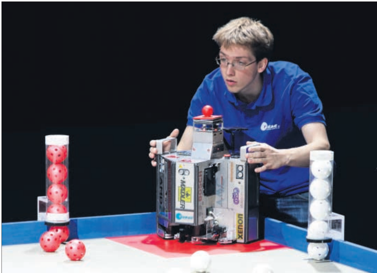
Mensch und Maschine beim gesteuerten Beherrschen der runden Materie.

Die Zweikämpfe der intelligenten Automaten können im Hörsaal 81 im Potthoff-Bau beobachtet werden. Auch kann man den Teams zwischen den einzelnen Wett-