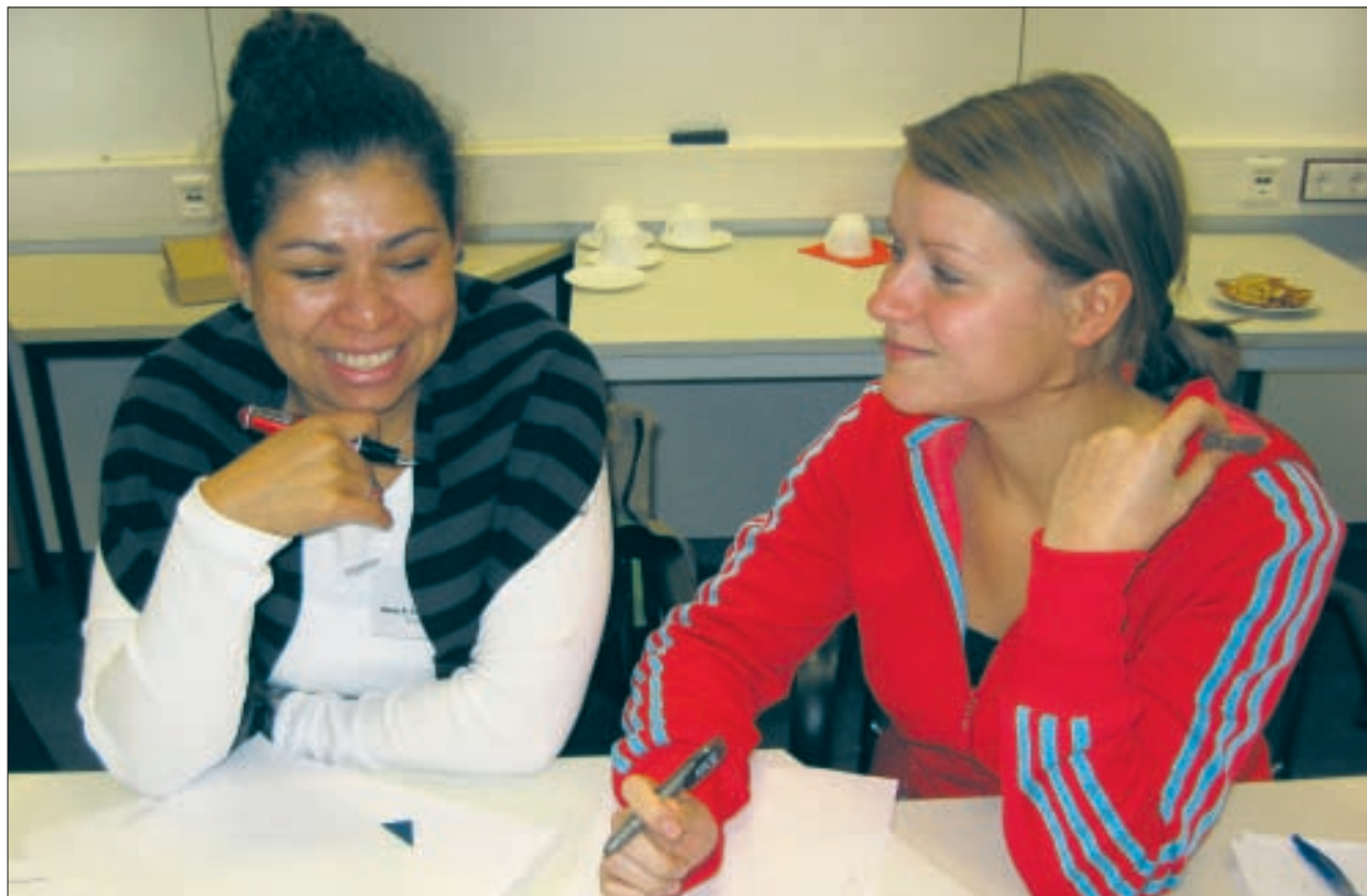
Den Berufseinstieg mit einem Mentor zu meistern, erleichtert die Sachen nicht nur, sondern macht auch Spaß.

Auch für die beteiligten Mentoren haben die initiierten Beziehungen einiges zu bieten: das Programm stellt für sie den direkten Kontakt zu hochqualifizierten Nachwuchswissenschaftlerinnen her, die mit ihrem aktuellen Fachwissen, das zeigt die Erfahrung, oft genug auch für die teilnehmenden