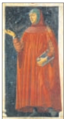
Andrea del Castagno: Francesco Petrarca.

In der Vortragsreihe »Classici Italiani« geht es am 5. Mai um Petrarca