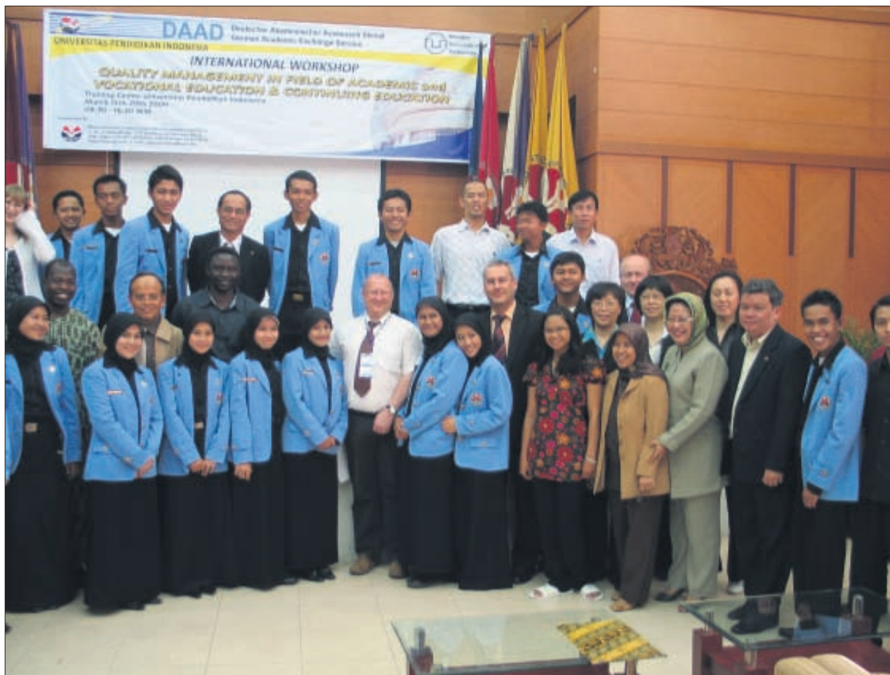
Teilnehmer des Alumni-Workshops »Quality Management in Field of Academic and Vocational Education & Continuing Education« an der Indonesian University of Education in Bandung.

Wichtigstes Ziel des Netzwerkes ist es, für alle Beteiligten einen kontinuierlichen Austauschprozess zu aktuellen Fragen der Wirtschaftsförderung und im speziellen der Förderung klein- und mittelständischer Unternehmen in Entwicklungs- und Transformationsländern zu ermöglichen. Den in der Berufsbildung und technischen Lehrerbildung tätigen Absolventen ermöglicht das Netzwerk die Beteiligung an der internationalen berufspädagogischen Diskussion und unterstützt sie somit beim Aufbau einer leistungsfähigen beruflichen Bildung in ihren Heimatländern. Neben