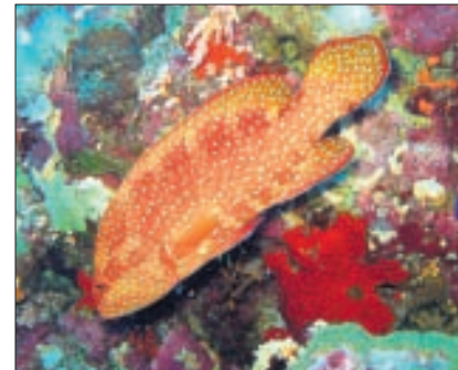
Ein echter Juwelen-Zackenbarsch ( Cephalopholis miniata ) im Hausriff »The Islands«.

von Lebewesen geschaffenen Strukturen der Erde. Sie sind so groß, dass sie einen bedeutenden physikalischen und ökologischen Einfluss auf ihre Umgebung ausüben. Das Korallenriff wird von hermatypischen (riffbildenden) Nesseltieren, den Korallen, über sehr lange Zeiträume aufgebaut. Im Wesentlichen tragen Steinkorallen ( Scleractinia ) und Feuerkorallen ( Millepora ) zur Riffbildung bei. Sie bauen in Laufe vieler Jahrhunderte aus ihren Kalk-Skeletten die Riffstruktur auf. Korallenriffe sind komplexe und äußerst empfindliche marine Ökosysteme – bieten den Raum für enge Lebensgemeinschaften von Pflanzen und Tieren. Die beeindruckenden Strukturen und auch die Zerbrechlichkeit üben eine starke Faszination aus. Taucht man in diesen einzigartigen Lebensraum ab, betritt man eine ganz andere Welt. Unter Wasser ist man von einer absoluten Ruhe umgeben. Man hört nur noch seinen eigenen Atem – das ist schon ein Schauspiel für sich... Man schwebt im Wasser und die Luftblasen vom Ausatmen steigen langsam in Richtung Wasseroberfläche auf. Es ist ein unbeschreiblich schönes Gefühl, wenn