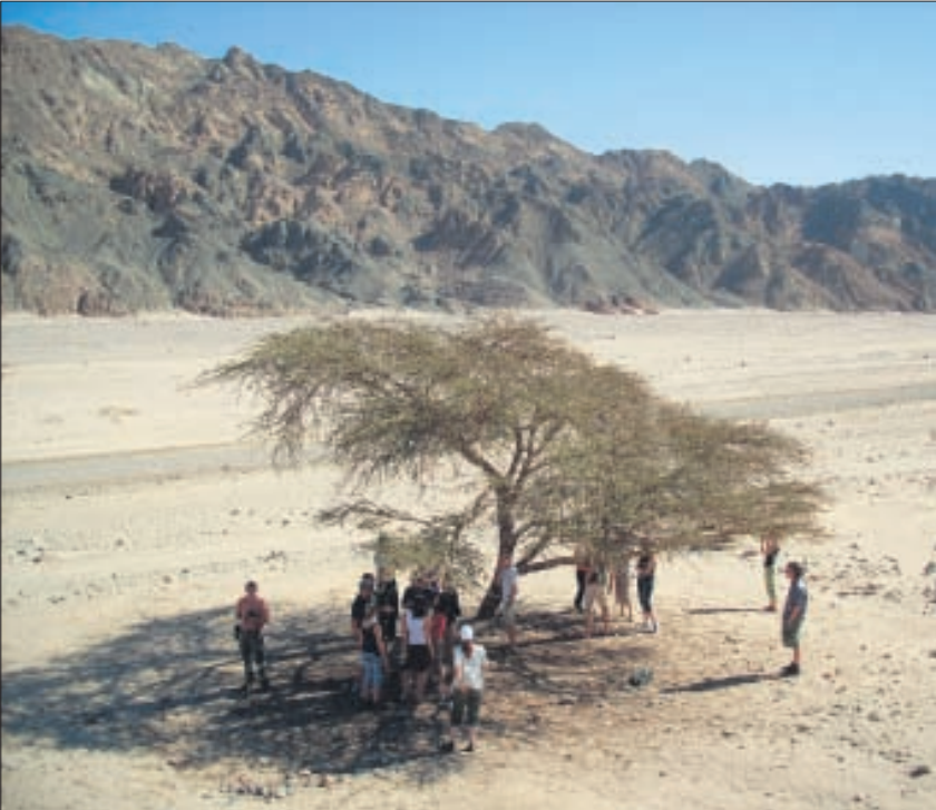
Weit und breit der einzige Baum im Wadi »Kid«: eine Akazie ( Acacia radiata ).

Bevor die Reise jedoch beginnen konnte, wurde im Rahmen einer Seminarreihe das Exkursionsziel vertraut gemacht. Dabei wurde primär das Leben im Riff, aber auch das Leben oberhalb der Wasseroberfläche vorgestellt. So bekam man ein genaues Bild, was uns vor Ort erwarten würde.