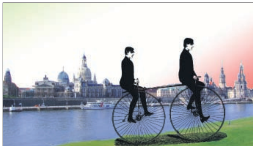
Tandem sull'Elba – wörtlich genommen.