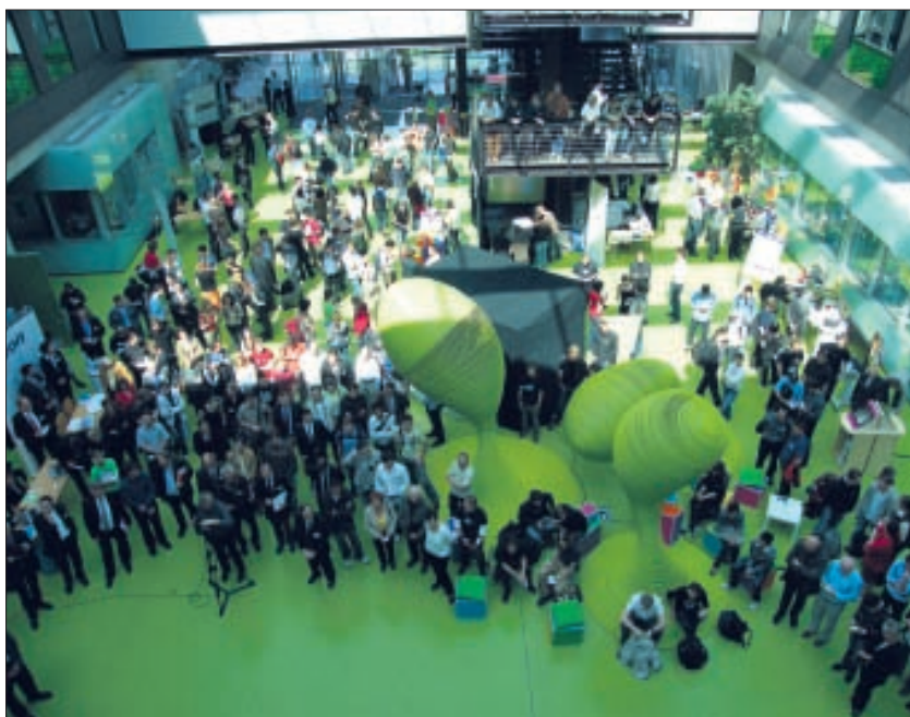
Dichtes Gedränge bei »OUTPUT« im Informatikgebäude.

OUTPUT – das studentische Projekt (Komplexpraktikum) der Fakultät Informatik – fand bereits zum vierten Mal statt. Seit 2007 verbindet sich OUTPUT mit dem Innovationsforum »Software Saxony« des