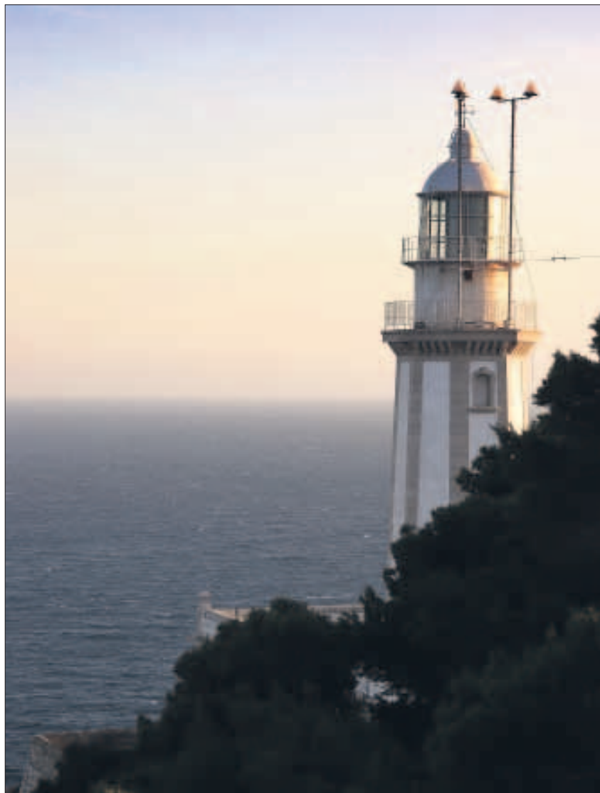
Vorhandene Leuchttürme sichtbar machen – so kann man eine der Aufgaben formulieren, vor denen die TU Dresden steht.

Im internationalen Vergleich fällt auf: Die deutschen Universitäten genießen in Hochschulrankings bei Weitem nicht die