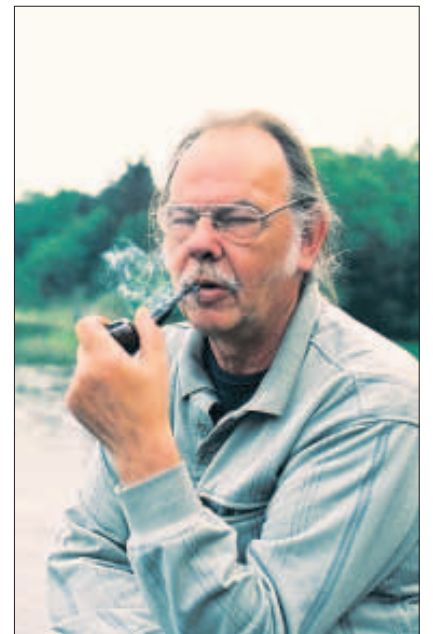
»Am Ende der Milchstraße«: Harry ist in den 80er-Jahren ins Dorf gekommen und gilt als exotischer Einzelgänger.

➔ »Am Ende der Milchstraße« läuft im Programm kino Ost