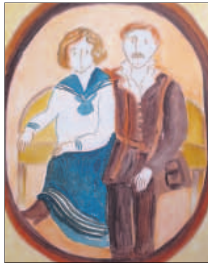
Titelblatt zur Ausstellung.

Dabei geht es um ganz alltägliche Begebenheiten, die die Welt des Mädchens in den 1930er- und 1940er-Jahren prägten, wie die Freundschaft mit den beiden Cousins und den Kindern der Bauern, die Schule, religiöse Probleme, die faszinierende Per-