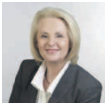
Christine Clauß Sächsische Staatsministerin für Soziales und Verbraucherschutz

➔ Genauere Infos auf: www.studentenwerk-dresden.de