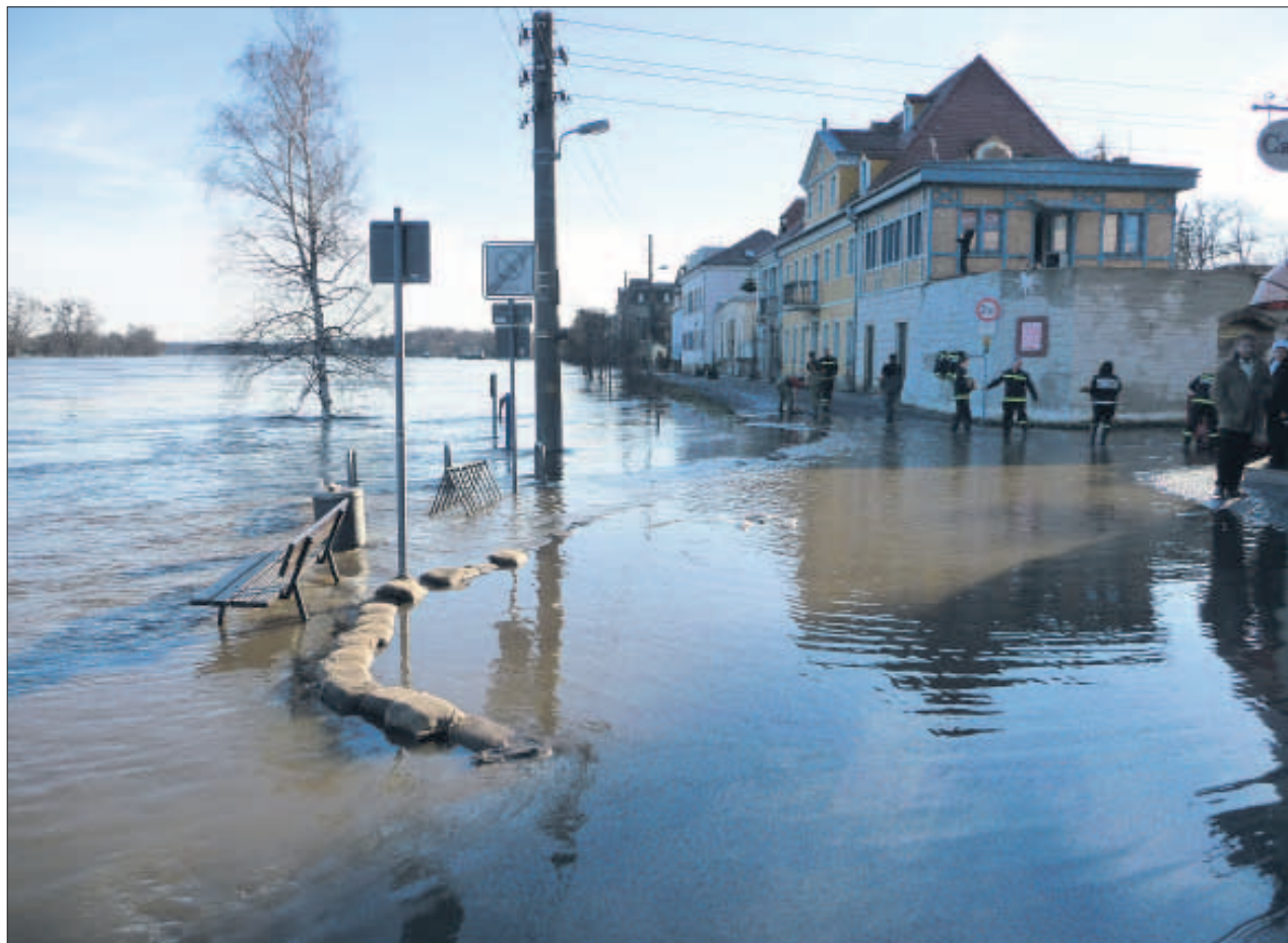
Extreme Wetterereignisse – Hochwasser, Hitze und Trockenheit – werden in unseren Breiten häufiger. Hier das Hochwasser der Elbe in Laubegast 2011.

Diese Phänomene zählen jedoch nicht zu den einzigen Herausforderungen. Der Wandel der klimatischen Bedingungen führt zu Problemen in allen gesellschaftlichen Bereichen, in der Wirtschaft, der Energieversorgung, auf dem Arbeitsmarkt und besonders relevant in der Wasserwirtschaft. Kanalsysteme können zu klein wer-