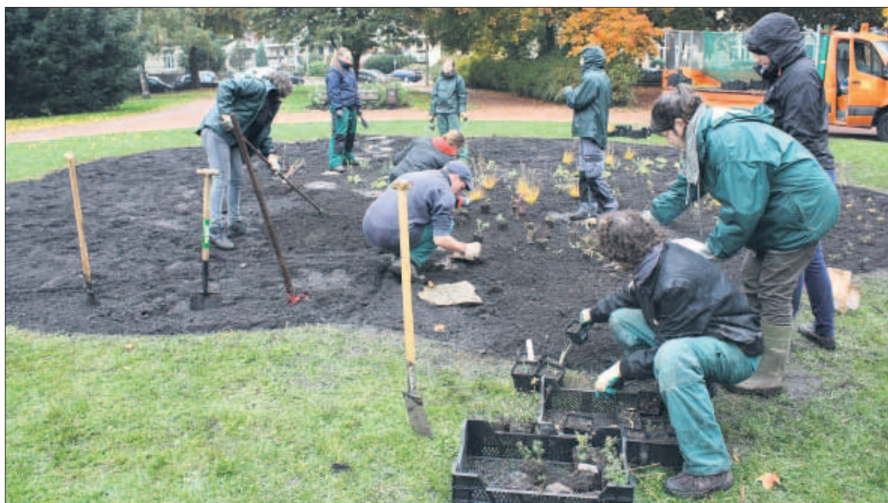
Gepflanzt wurde von den Studenten selbst. Zu neun wurden die vorgesehenen Pflanzen innerhalb von vier Stunden in die Erde gebracht.

Das Prinzip ist denkbar einfach: Weniger saisonale Pflanzen, mehr ausdauernde Stauden. Letztere sterben im Herbst nicht ab, sondern überdauern den Winter, treiben jedes Jahr neu aus und bilden Blüten. Das spart Kosten, denn einjährige Pflanzen