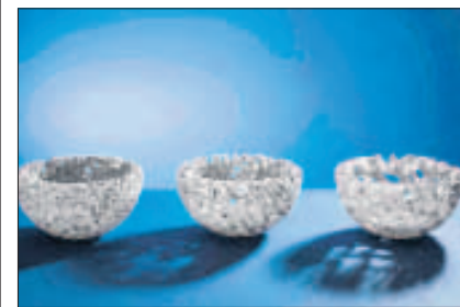
»Evolving Bowl«.