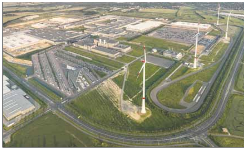
Große und hochwertige Gewerbeflächen – hier das Areal der BMW AG in Leipzig – sind mittlerweile in der Region rar.

Für die Region Halle/Leipzig wird die Professur Raumordnung – in enger Abstimmung mit den regionalen Partnern aus Planung, Politik und Verwaltung – in den kommenden Monaten eine Strategie zur Gewerbeflächenentwicklung mit mittel- und langfristigen Zielen und Umsetzungsmaßnahmen erarbeiten. Damit verknüpft ist die Frage, wie die Zusammenarbeit künftig ausgestaltet werden soll. Auch hierzu werden Vorschläge für eine tragfähige Governance-Struktur erarbeitet, die der Kooperation dient, gemeinsam gesteckte Ziele