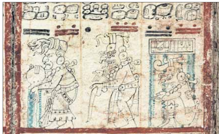
Die Maya-Handschrift, deren Seiten 20,5 mal 9 Zentimeter messen, erweist sich in der Vergrößerung auch als monumentales Bildwerk (SLUB Mscr.Dresd.R.310).

➔ Original und digital – Schätze der SLUB und die Kunst ihrer Reproduktion – bis 16. März, täglich 10 bis 17 Uhr geöffnet. Öffentliche Führung am 12. Februar, 17 Uhr