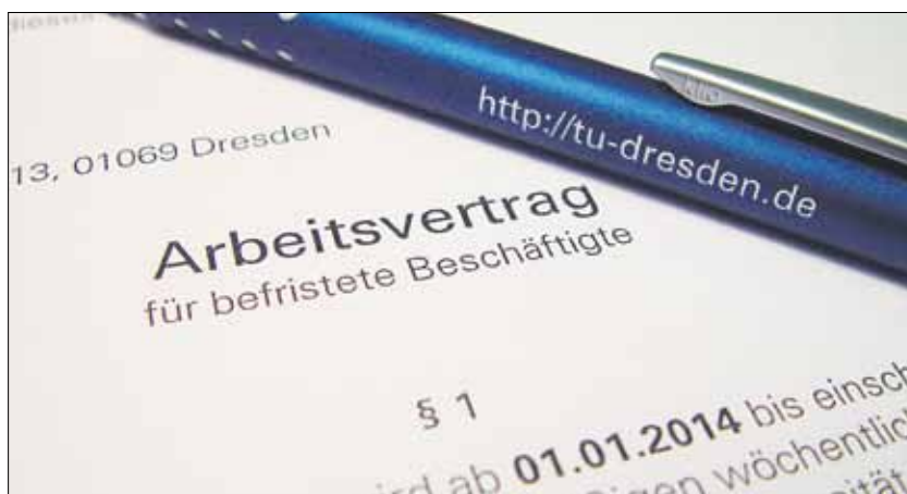
Die Umfrage der Mittelbauinitiative Dresden an der TUD ergab, dass von den mehr als 1300 Teilnehmern 92 Prozent befristet angestellt sind.