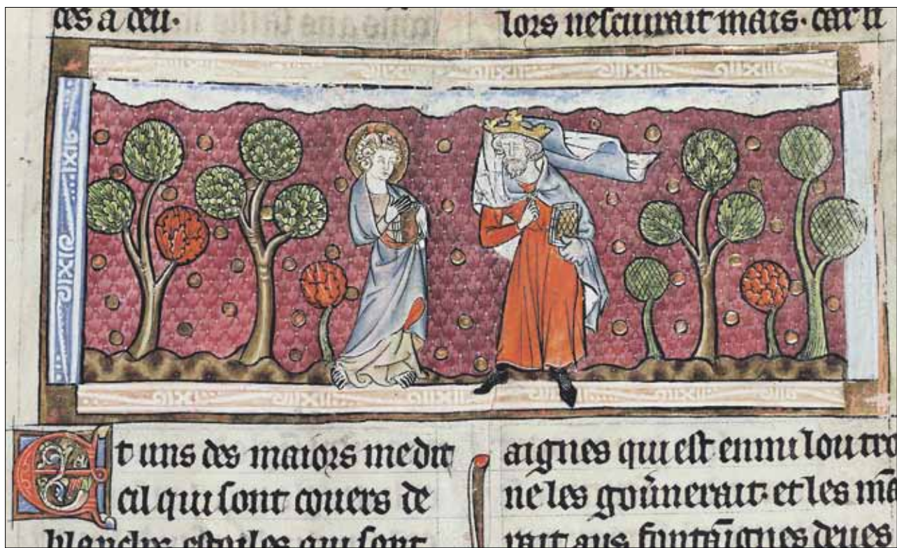
Johannes (Evangelist): Li Apocalypse que S. Jehans vit – durch die Digitalisierung können kleine, sonst kaum wahrnehmbare Bild-Details erkannt werden (SLUB Mscr.Dresd.Oc.50).

Der epochale Unterschied besteht also darin, dass einerseits derartige Einblicke allgemein und mit geringstem Aufwand zugänglich gemacht werden können, während bisher Originale von besonders hohem Wert nur sehr eingeschränkt oder in Gestalt wiederum recht kostbarer Reproduktionen studiert werden konnten, wobei dann immer noch in Kauf zu nehmen war, dass etwa der 1902 entstandene Leipziger Faksimiledruck des berühmten »Sachsenspiegels« nur wenige Farbtafeln enthält. Kein zufälliges Beispiel, denn dieser Rechtskodex war eines der ersten Objekte, mit denen die SLUB im Jahr 2000 ihr Projekt der Massendigitalisierung anging, damals noch mit Aufnahmen relativ geringer Auflösung (3,4 Megapixel bei einer Originalgröße von 26 mal 33 Zentimetern), die aber im pigmentierten Tintenstrahldruck schon ein beeindruckendes Ergebnis liefert und das sogar