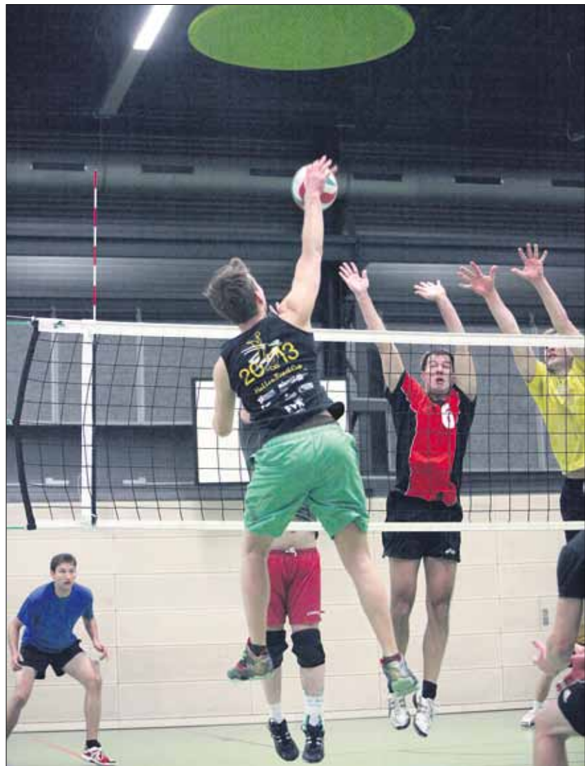
Neun Fakultäten kämpften am Netz um Satz- und Spielsieg.