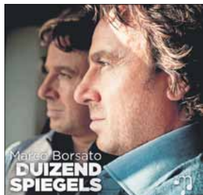
Marco Borsato: Duizend spiegels (Universal Music, 2013).

Es waren lange drei Jahre seit dem letzten Studioalbum »Dromen durven delen« (2010), die auch die zwischenzeitlichen Auskopplungen eines Live-Albums und einer Best-of-Scheibe (natürlich nur seine 16 Nummer-eins-Hits) nicht kürzer werden ließen. Am 22. November 2013 ging ein Ruck durch das niederländische Musikvolk – Marco Borsato war mit seinem neuen Album »Duizend spiegels« zurück! Man stürmte die Plattenläden und Online-Shops und Ende 2013 stand fest: Das meistverkaufte Album der Niederlande 2013 ist »Duizend spiegels«. Dubbel Platina gabs obendrein – nichts neues also für den Sänger, der seit den 90er-Jahren unangefochten als König des Pop die Niederlande regiert.