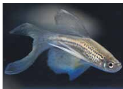
Welcher Mechanismus ermöglicht es dem Zebrafisch, Nervenzellen nachwachsen zu lassen?

Alzheimer Forschung Initiative e.V. unterstützt Dresdner Forscher mit 79.925 Euro