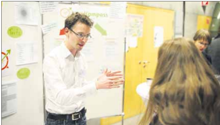
Die Gründerfoyers – hier während der 41. Auflage im November 2013 – gehören zu den wichtigsten Veranstaltungen von »dresden exists« für Gründer.

So können Gründungsinteressierte beim Gründerfoyer von namhaften Unternehmen lernen oder sich beim monatlichen Gründertreff austauschen. Die eigene Geschäftsidee kann im GründerCamp strukturiert und zu einem tragfähigen Geschäftskonzept geführt werden. Vorlesungen und Seminare vermitteln zudem unternehmerische Kompetenzen und das nötige Fachwissen von Finanzierung über Vertrieb und Marketing bis hin zu Rechts- und Steuerfragen. Dr. Frank Pankotsch von »dresden exists«: »Im Laufe der Jahre haben wir durch unsere Arbeit bei der Schaffung von mehr als 1000 Arbeitsplätzen geholfen und damit gut ausgebildete