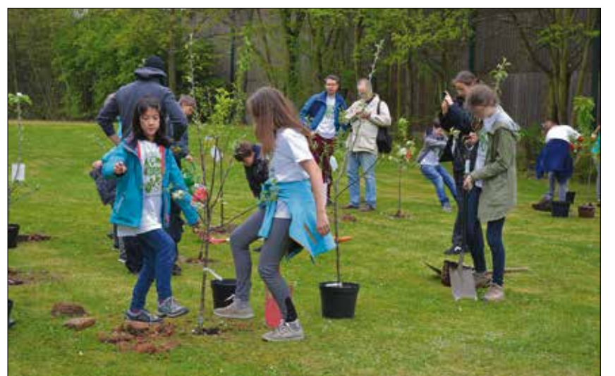
Kinder pflanzen Bäume – Plant for Planet.