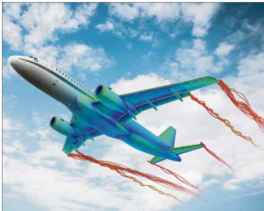
Im neuen Zentrum soll die deutsche Flugzeug-Entwicklung auf eine neue, durchgängig digitalisierte Stufe gehoben werden. Visualisierung: DLR

Tatsächlich mutet das neue Institut in vielerlei Hinsicht wie von langer Hand geplant aus – unter maßgeblicher