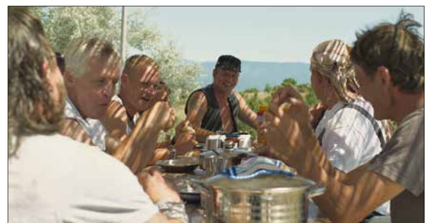
»Western« – Atmosphärische Erlebnisse tief im Südosten.

Blieben weitere eingeführte Western-Elemente: Der Fluss rauscht wie der Klondike River, das Pferd ist weiß, die Frauen im nahen Dorf sind stolz, die Einheimischen alles im Spektrum zwischen ablehnend, neugierig und nett. Bauern und Klügel-Chefs haben ihre eigenen Regeln, die importierten Deutschen nicht minder. Für die einen ist es eine Balance zwischen Einlass und Aus-