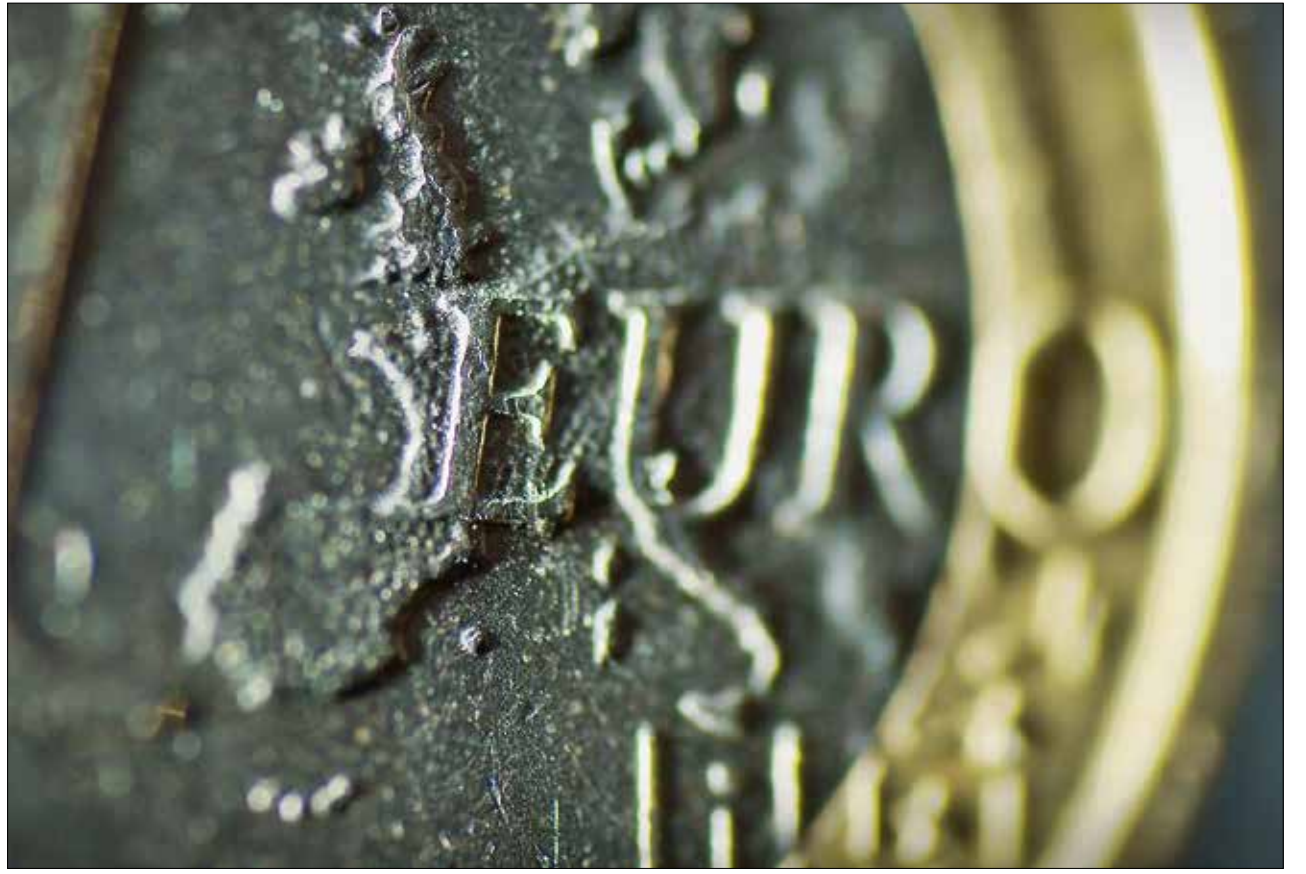
Der Euro in der Diskussion – am 20. September im Lingnerschloss Dresden, mit TUD-Professor Stefan Eichler.

Sicherlich war der Zusammenbruch am US-amerikanischen Immobilienmarkt und der sich daraus ergebende Abschreibungsbedarf der Banken Auslöser der europäischen Finanzkrise. Allerdings lassen sich Länge und Besonderheiten der europäischen Finanzkrise wohl eher mit Konstruktionsfehlern des Euros erklären. Die Einführung einer gemeinsamen Währung ohne eine koordinierte Fiskal- und Wirtschaftspolitik auf europäischer Ebene war sicherlich fahrlässig. Zwar haben sich die Nominalzinsen der Länder angeglichen, nicht aber die Inflationsraten und fiskalischen Defizite. Die Wettbewerbsfähigkeit der deutschen Industrie hat sich durch die geringen Reallohnzuwächse stetig verbessert, südeuropäische Länder haben an Wettbewerbsfähigkeit eingebüßt. Mit der Finanzkrise haben sich diese Divergenzen noch verschärft. Die ökonomischen und politischen Fliehkräfte in der Währungsunion waren teilweise so stark, dass ein ernsthaftes Risiko von Austritten aus der Eurozone bestand. Die EZB tut mit ih-