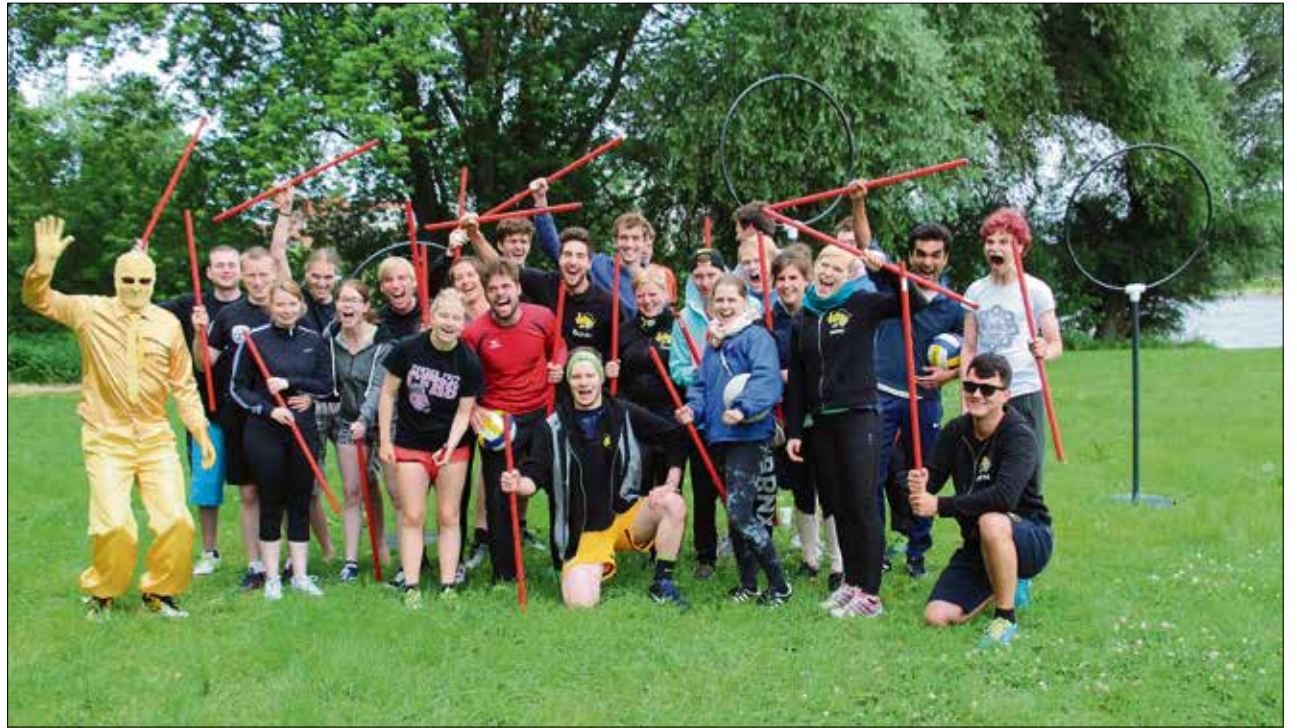
Fun-Sportart Quidditch: Das zu fangende Objekt war eine Socke, die eine golden gekleidete Person im Hosenbund stecken hatte.

Rund 270 Aktive kamen am 16. und 17. Juni nach Riesa. »Wir hätten Kapazitäten für mehr Teilnehmer gehabt, sind aber dennoch mit dieser Zahl zufrieden: Denn an diesen Tagen fanden parallel mehrere andere attraktive Veranstaltungen statt, wie die BRN in Dresden oder die Lange Nacht der Wissenschaften«, sagt Julia Freitag, USZ-Mitarbeiterin und Geschäftsführerin der LHS. »Unser Ziel war, dass sich Studenten auf sportlicher Basis messen