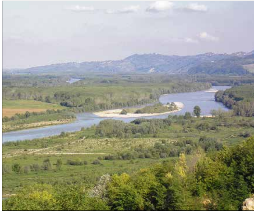
Attraktive Po-Landschaft: Fluss umgeben von Hügeln.