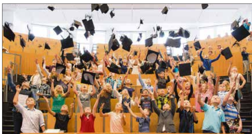
Hurrah – die Juniordoktoren freuen sich.