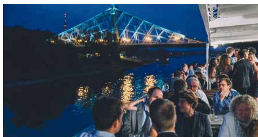
Wissenschaftsfahrt: Romantische Stimmung, gute Gespräche.