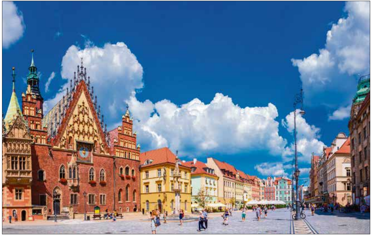
Das historische Zentrum von Breslau (Wroclaw).

Diese wollen die Zusammenarbeit der Nachbarländer in Forschung und Entwicklung effektiv und nachhaltig ausbauen. Gemeinsam sollen sowohl Impulse für das Wachstum der Region gesetzt als auch international konkurrenzfähige Lösungen für den gesellschaftlichen Wandel entwickelt werden. Der Sächsisch-Polnische Innovationstag steht, wie die Wissenschaftsausstellung, unter der Schirmherrschaft des Generalkonsulats der Bundesrepublik Deutschland in Wroclaw und des Sächsischen Staatsministeriums für Wissenschaft und Kunst. Veranstalter sind das Transfer Office der Technischen Universität Dresden, das Verbindungsbüro des Freistaates Sachsen und die Technische Universität Wroclaw. Der Innovati-