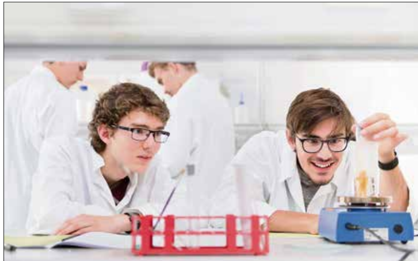
Schüler im Gläsernen Labor im Deutschen Hygiene-Museum.

»Vielen Dank, dass ich bei der Sommeruniversität in Dresden teilnehmen durfte. Es hat mir total viel Spaß gemacht und jetzt habe ich eine gute Vorstellung, wie es ist, in Dresden zu