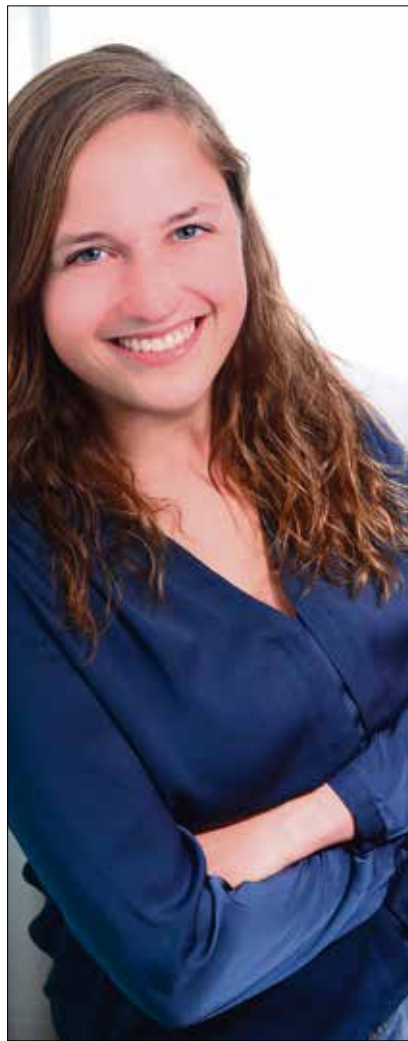
Frisch verheiratet, bald junge Mutti – und danach wieder eingebunden im Beruf.

Einen Mann habe ich als Mentor im Vorhinein ausgeschlossen, da es mir sehr auf die weibliche Blickweise ankommt, insbesondere was die Vereinbarkeit von Familie und Beruf angeht. Ich habe lange recherchiert