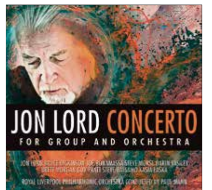
Die 2012-er Studioversion.