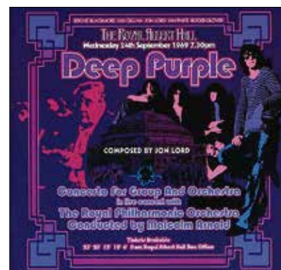
Die remasterte Doppel-CD von 2002.