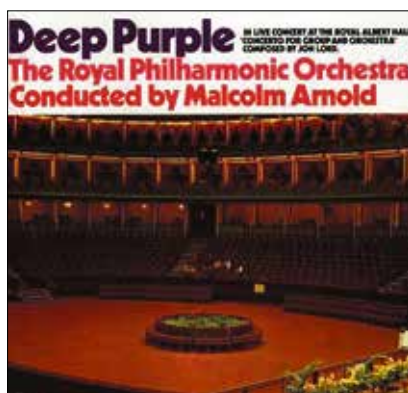
Das Concerto von 1969 auf EMI (1990).

Am 8. August 2014 erschien bei Warner Music eine Neuauflage des Konzertmitschnitts »Concerto For Group And Orchestra«. Auf drei LPs enthält sie erstmals auf Vinyl das komplette Abendprogramm des Londoner Konzerts vom 24. September 1969 samt 16-seitigem informativem Booklet.