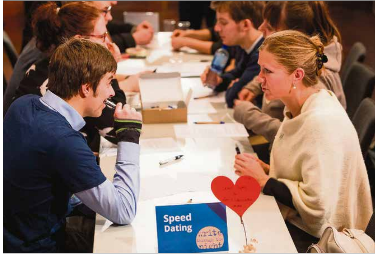
Startimpuls für Schreibinteressenten: die Lange Nacht des Schreibens.

Die Gruppe der sechs Männer ist eine Lerngruppe. Davon gibt es momentan an der Uni im Rahmen der genannten