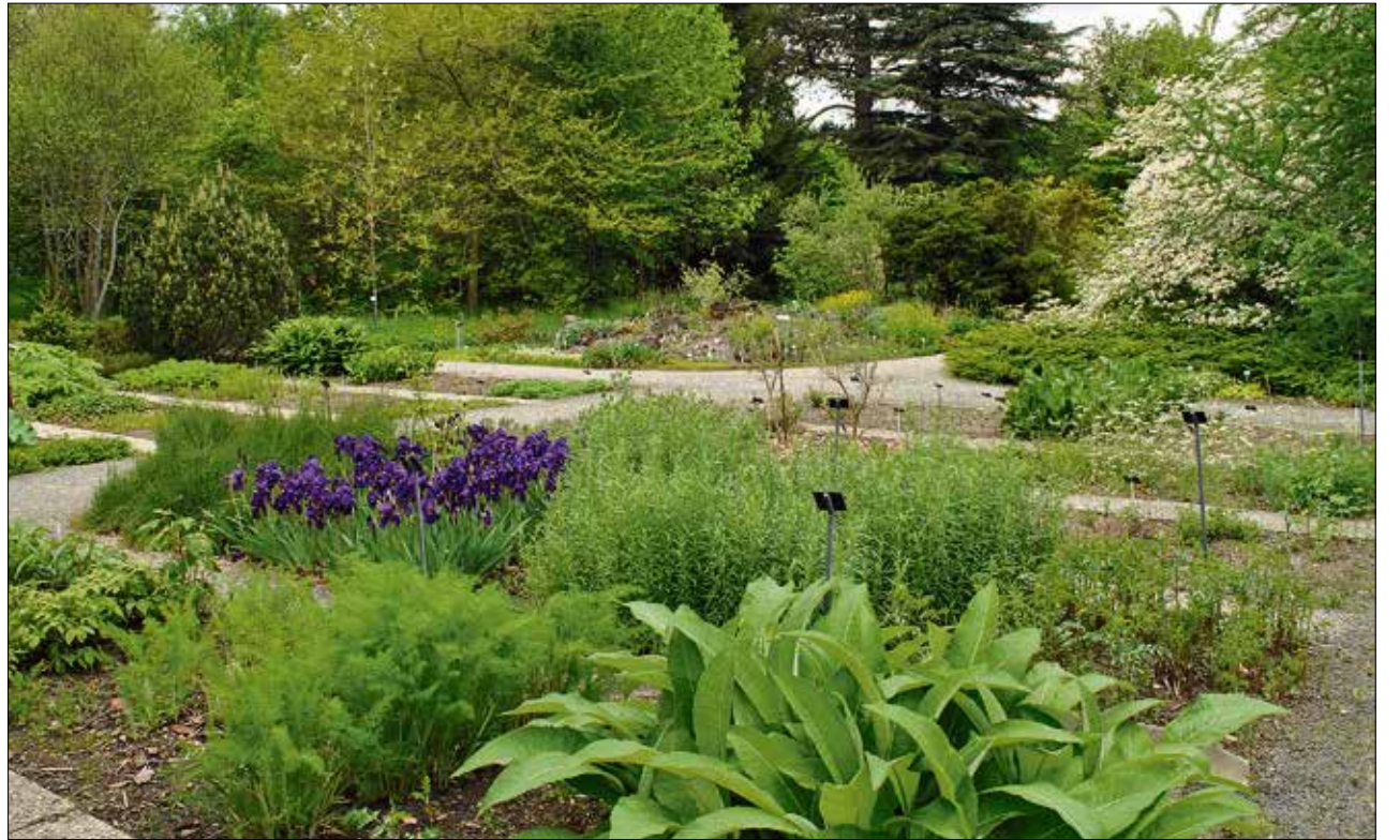
Das Arzneipflanzenareal des Botanischen Gartens der TU Dresden.