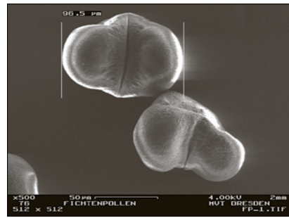
Die REM-Aufnahme zeigt die beiden Luftsäcke am Pollenkorn – beste Gewähr für flotte Fernflüge.

Was den Autobesitzer nervt, fasziniert die Mitarbeiter der Arbeitsgruppe Mechanische Verfahrenstechnik des TUD-Instituts für Verfahrenstechnik und Umwelttechnik. Eigentlich beschäftigt sie sich mit der Charakterisierung von Nanopartikeln aus industri-