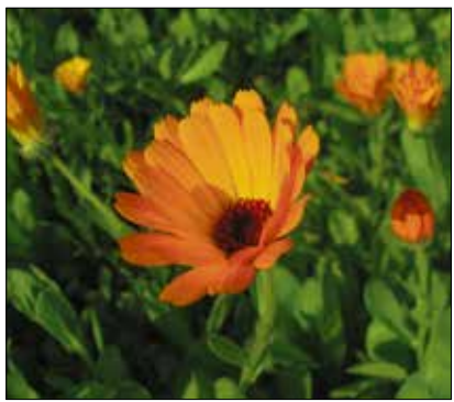
Die Ringelblume ( Calendula officinalis ) fördert die Wundheilung und hilft bei Entzündungen der Haut.

Schätzungen zufolge werden weltweit rund 30 000 verschiedene Pflanzenarten für medizinische Zwecke ge-