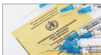
Bereit zur Impfung?

Nach der Grundimmunisierung im Säuglings- bzw. Kleinkindalter sind bis zum Lebensende regelmäßige Auffrischimpfungen, z. B. gegen Tetanus, Diphtherie und Keuchhusten, erforderlich, damit der notwendige Impfschutz erhalten bleibt. Nichtsdestotrotz sind viele Erwachsene nachlässig, was die Auffrischung von Impfungen angeht. Im Rahmen der Arbeitsmedizinischen