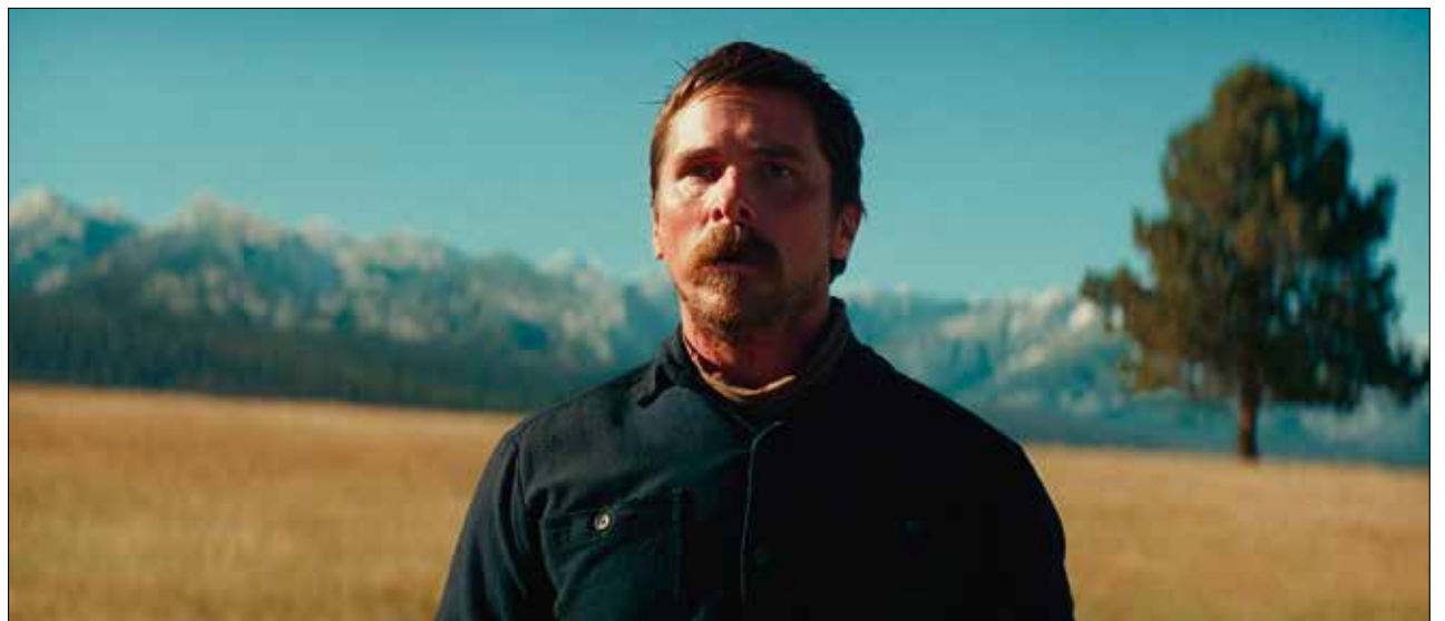
Christian Bale als Captain Joseph Blocker.

Ein Auftrag, ein letzter vor der frühen Pensionierung, lässt ihn für entschei-