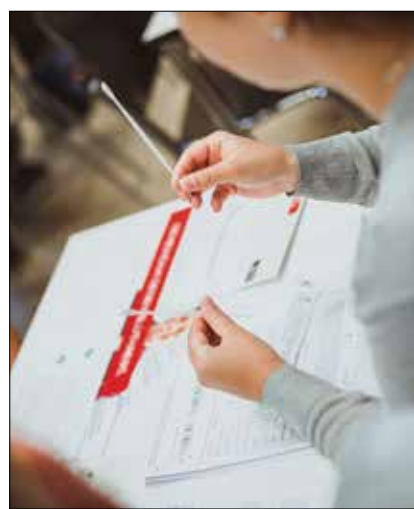
Drei Wattestäbchen, ein Formular – und schon ist die Registrierung so gut wie geschafft.

Aller 15 Minuten erkrankt in Deutschland ein Mensch an Blutkrebs – einer Erkrankung des blutbildenden Systems. Es ist die häufigste Krebsart bei Kindern. Oft ist die letzte Chance auf Leben eine Stammzellspende. Allerdings findet jeder Zehnte keinen Spender, der ihm das Leben retten könnte. Die Suche nach dem perfekten Match ist wie die Suche nach der Nadel im Heuhaufen, da die Gewebemerkmale von zwei Personen genau übereinstimmen müssen. Man sucht also seinen genetischen Zwilling. Daher ist es wichtig, den Pool an Spendern stetig zu vergrößern. Und jeder auf dem Campus trägt das Heilmittel in sich!