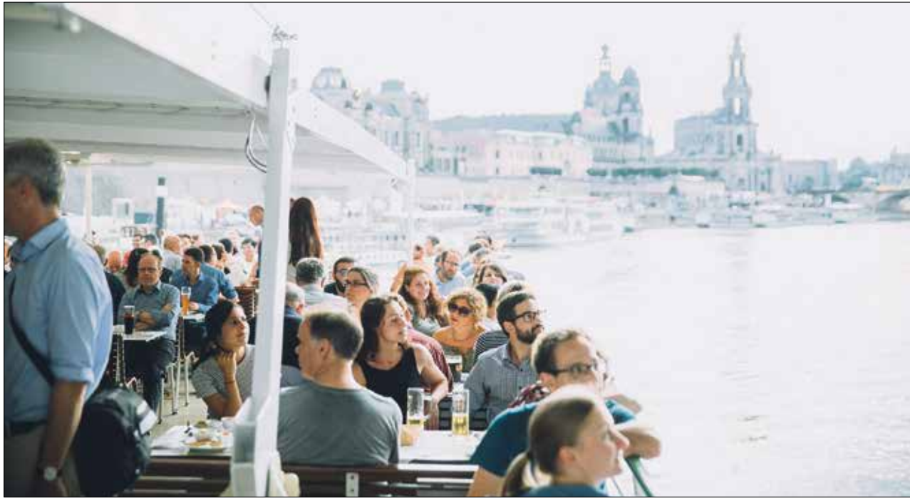
Bereits im letzten Jahr war die Wissenschaftsausfahrt ein voller Erfolg.

DRESDEN-concept startet zur zweiten Wissenschaftsfahrt auf der Elbe