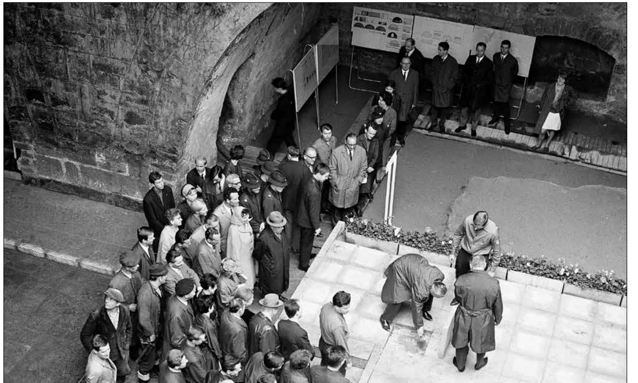
16. Juni 1967: Der Grundstein für den Bärenzwinger wird gelegt.

In der großen Tonne findet am 8. Juni ein Konzert mit noch geheimer Band sowie am 9. Juni eine Hip-Hop-Party statt. Am 10. Juni schließt die Festwoche mit einem Brunch und musikalischer Unterhaltung von Sasa und der Bootsmann.