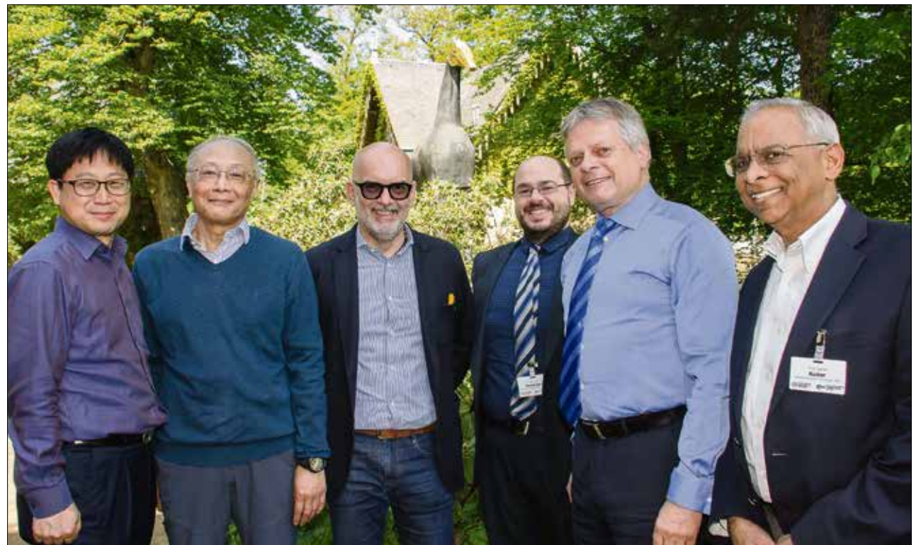
Dem Forschungsnetzwerk zum Thema Carbonfasern gehören Wissenschaftler aus Japan, Südkorea, Australien, den USA, Frankreich, Griechenland, Belgien und Deutschland an. Die Leitung hat Prof. Hubert Jäger (z.v.r.).

»Rechtsquellen: § 6 TV-L: Regelmäßige Arbeitszeit § 7 TV-L: Sonderformen der Arbeit [auch i. V. m. § 81 (3) SächsPersVG] § 8 TV-L: Ausgleich für Sonderformen der Arbeit ArbZG: Arbeitszeitgesetz, insb. §§ 3, 4, 5 und 11 §§ 8, 11 JArbSchG: Jugendarbeitschutzgesetz RS D2/04/2000: Arbeitszeit an der TUD vom 16. Juni 2000