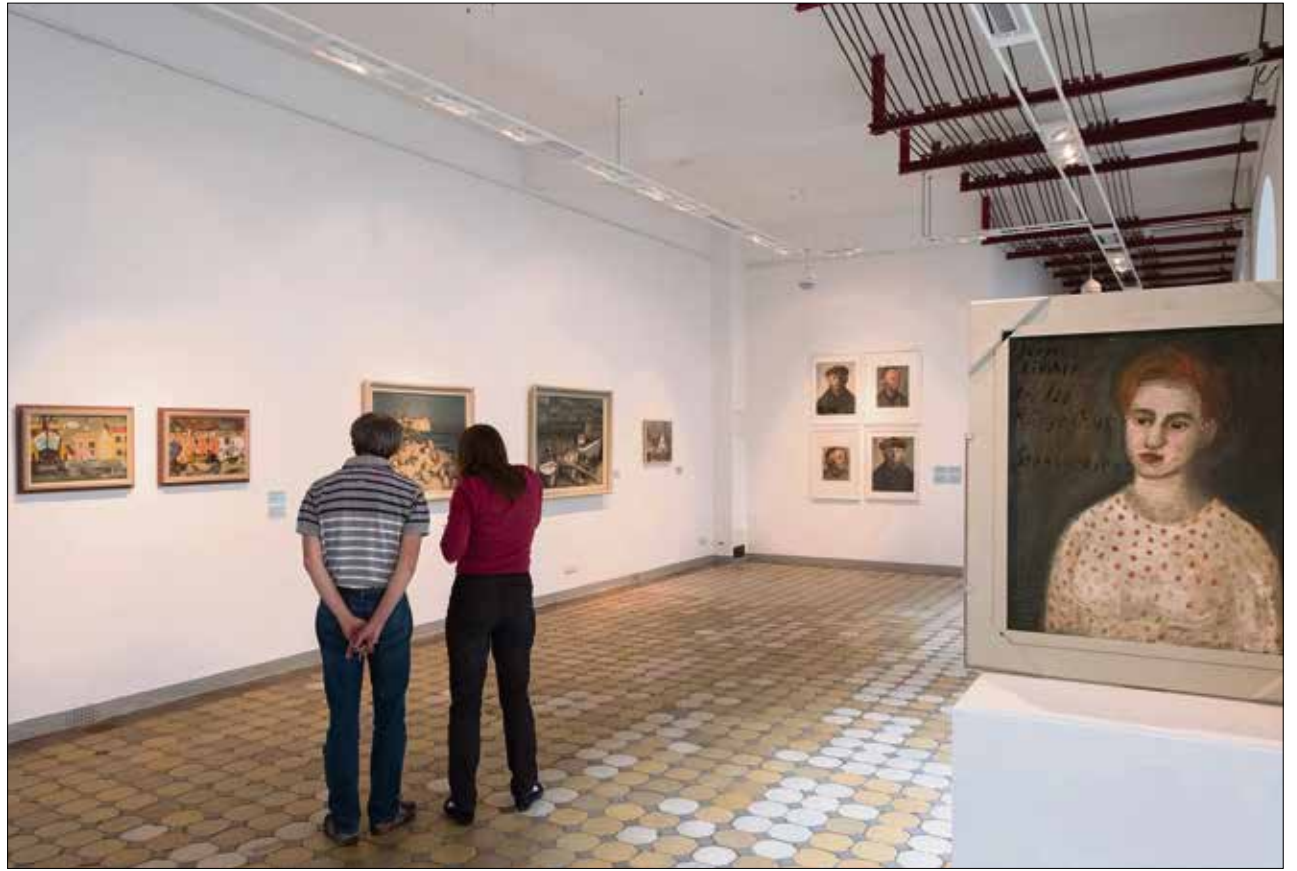
Blick in einen Ausstellungsbereich der Altana-Galerie im Görges-Bau.

Es ging bei den ersten Erwerbungen der aufstrebenden Lehranstalt, auch wenn sie eine gewisse nicht unwichtige Rolle spielten, keineswegs nur um Wissenschafts- oder Aufbau-Themen, bei den Aufträgen nicht nur um Porträts von Wissenschaftlern bzw. Rektoren. Vielmehr sah man damals die Kunst (manchmal mit eingefärbter Brille) als integralen unverzichtbaren Bestandteil des Lebens und nicht zuletzt als eine auch der Arbeitsatmosphäre zuträgliche wie geistig anregende Größe an, und entsprechend war es auch ganz selbstverständlich, dass jeweils ein bis zwei Prozent der Baukosten für ein neues Lehr- Forschungs- oder Verwaltungs-