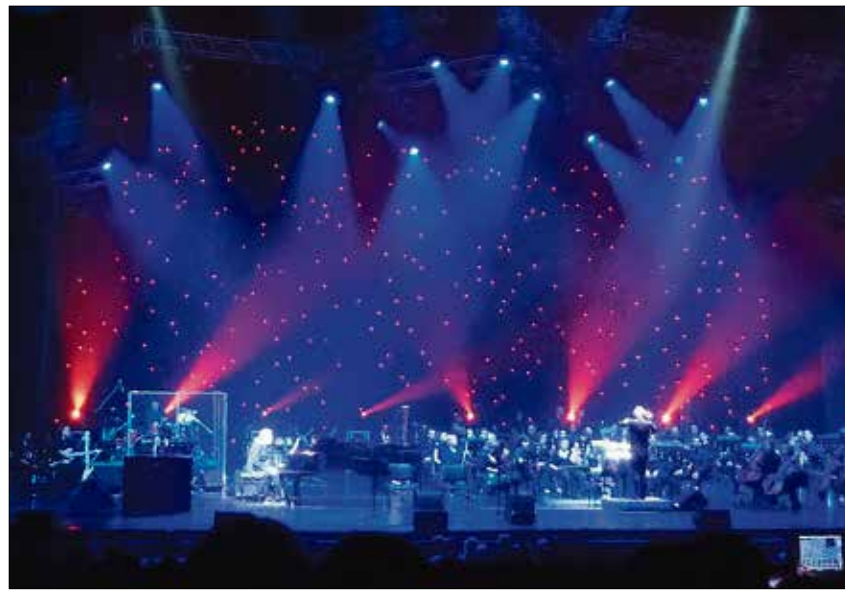
Jon Lord im Jahr 2011 in Sankt-Petersburg.

In folgenden Pizzicato-Passagen und Bläser-Einlagen mag man an die Moderne des vergangenen Jahrhunderts denken, in die hin und wieder ein Streicher-Segment einbricht, das verstört, verwundert, aber doch ganz gut passt. Bis, ja bis dann eine Rock-Formation teilhaben wird am virtuoseren Procedere, eine Rockband als Solist in diesem Großwerk - auf dessen Namen immer noch niemand gekommen ist? Noch vor der zehnten Minute dieses Dreiviertel-Stunden-Stücks (das in der Folge noch mit mancherlei Überraschungen aufwarten wird) gibt es weitere Irritationen, wenig später mi-