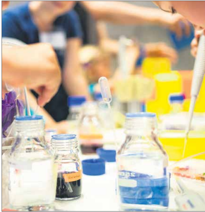
Zur 17. Langen Nacht der Wissenschaften am 14. Juni 2019 (Foto) war noch nicht absehbar, dass die Wissenschaftsnacht im Jahr darauf Corona zum Opfer fällt und im Jahr 2021 »nur« online stattfinden kann.

Campuseinblicke – Studierende führen in virtuellen Spaziergängen über ihren Campus In drei Kurzfilmen von je zwölf Minuten Länge nehmen Studierende der TUD die virtuellen Gäste mit auf einen Spaziergang über den Campus und präsentieren dabei Wissenswertes rund um die historischen Gebäude und die Menschen, die darin lehren, lernen und forschen. Wer noch mehr erleben will, kann sich von der angegebenen Webseite die »Action Bound App« downloaden und noch viel mehr Details rund um das studentische Leben erkunden.