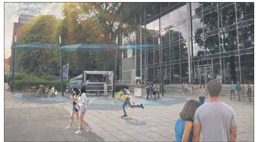
Derzeit noch »Freifläche vor dem Hörsaalzentrum« genannt, könnte das Areal bald einen schöneren Namen bekommen. Visualisierung: Tamara Jakoboy

Namens-Ideen für die beiden ersten Flächen, deren Design sich gerade in der Erstellung befindet, aber auch für alle