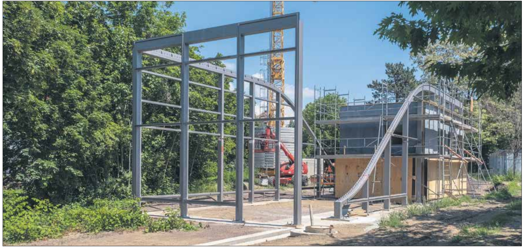
Die BOX (rechts) des Carbonbetonhauses steht bereits, nun wurde die Stahl-Glas-Konstruktion für die Fensterfront montiert. Aktuell laufen die Vorbereitungen für den Schalungsbau des TWIST, allerdings direkt bei der Hentschke Bau GmbH.

Gerade an diesen Punkten zeigt sich allerdings auch, wie unterschiedlich stark die Branchenbetriebe an Innovationen interessiert sind: »In Sachsen sind wir mit Sand und Kies reich gesegnet,