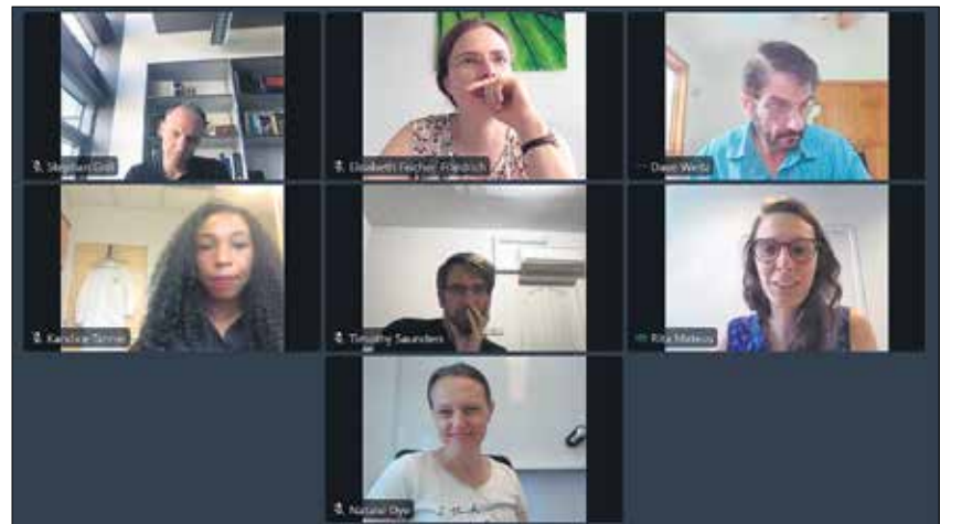
Während des virtuellen Workshops.

Das hochkarätige Programm beinhaltete unter anderem Themen wie die