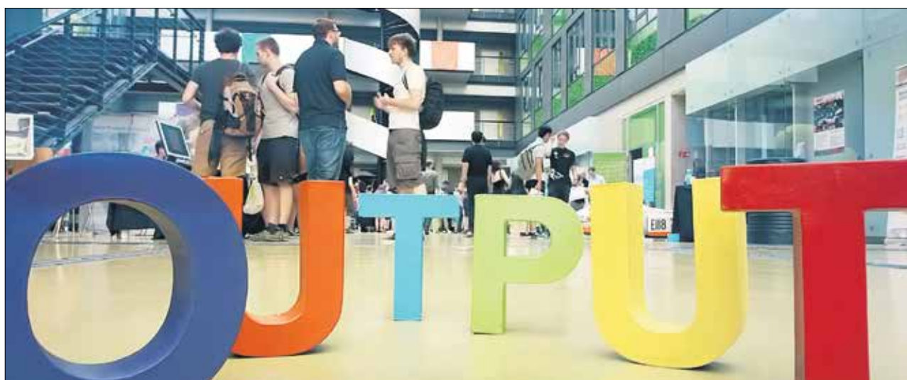
Normalerweise findet »OUTPUT.DD« im Gebäude der Informatik-Fakultät statt. Dieses Jahr braucht man einen Bildschirm dafür.

Zum 15-jährigen Jubiläum kommt OUTPUT.DD am 8. Juli erstmals digital daher. Ab 13 Uhr sind die vielfältigen