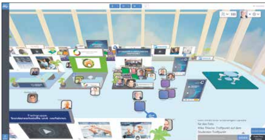
Parallel zu den digitalen Vortragssessions wurde eine interaktive virtuelle Messe aufgebaut.

Bereits jetzt beginnen die Planungen für das 25. Internationale Dresdner Leichtbausymposium am 30. Juni und 1. Juli 2022. Diana Wolfrum