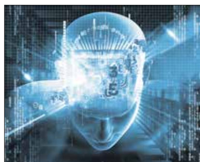
KI durchdringt immer stärker das alltägliche Leben.

gewährleisten, mit welchen Rezeptionsgraden? Welche Vor- und Nachteile bestehen bei unterschiedlichen Graden transparenter KI-Systeme? Wieso wird in ähnlich gelagerten Fällen von KI-Systemen mehr Transparenz als von menschlichen Akteuren gefordert? Führen KI-Systeme zur Verschleierung menschlicher Verantwortung? Welchen Einfluss hat die Kommunikation mit Maschinen auf das menschliche Kommunikationsverhalten?