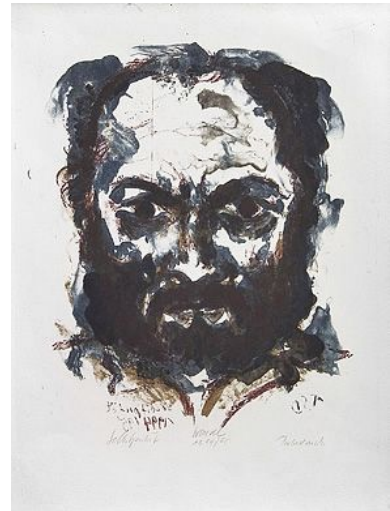
13 Jürgen Wenzel, Foto: Jürgen Wenzel, Jörg Kuß, Grafik: Jürgen Wenzel