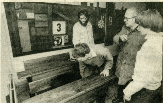
Am 4. Februar 1987 wurde die Assemblage im Wohnheim Borsbergstraße in Anwesenheit ihrer Schöpfer feierlich eingeweiht.

Denn, wem gehören Tafel, Stift und Schulbank anderem als dem Schulalltag. Türen scheinen uns den Blick in eine längst vergangene, oft in Vergessenheit geratene Welt zu öffnen, die Schulwelt von gestern, – mit heutigen Augen gesehen – liebevoll nostalgisch, in ihrer Drastheit herabgemindert, vielleicht idealisiert, da die Erinnerung am Unangenehmen radiert. Es werden Bilder wach aus der eigenen Vergangenheit, sie reichen weiter zurück als nur bis in die Schulzeit. Man spürt hinter den Gegenständen nicht nur das Erbe und die damit verknüpfte Tradition, man beginnt dem überdauernden die Vergänglichkeit einer Kinder- und Jugendzeit mit all ihren Träumen, Phantasien, mit freudigen und traurigen Erlebnissen zu begreifen und ist versucht, all das zu bewahren.