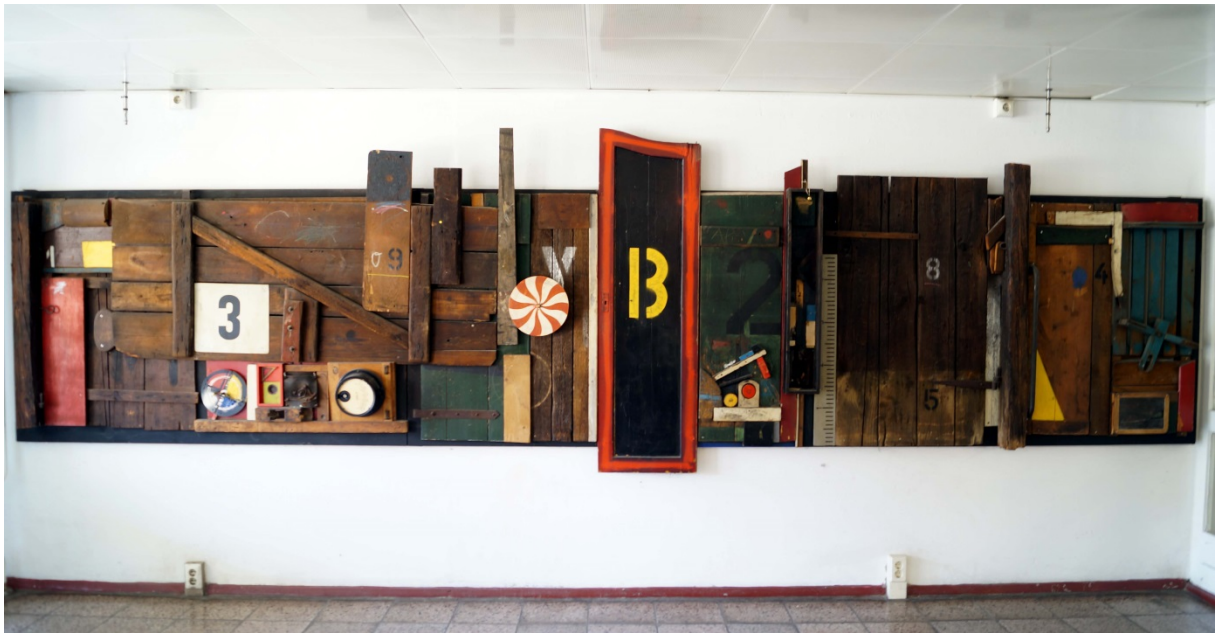
1 Wandbild/Holzassemlage "Schulgeschichten", Foto: Anne Gerbothe, überreicht von Anton Paul Kammerer

Wandbild im Wohnheim Dresden, Borsbergstraße 34, Holzassemlage "Schulgeschichten" Einweihung 04.02.1987 1