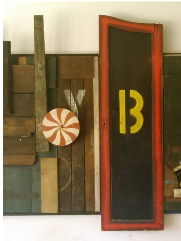
5 bewegliche Scheibe animiert zum Berühren und sorgt für interessante Effekte