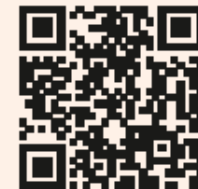
Illustration: Himbeerspecht Liane Hoder