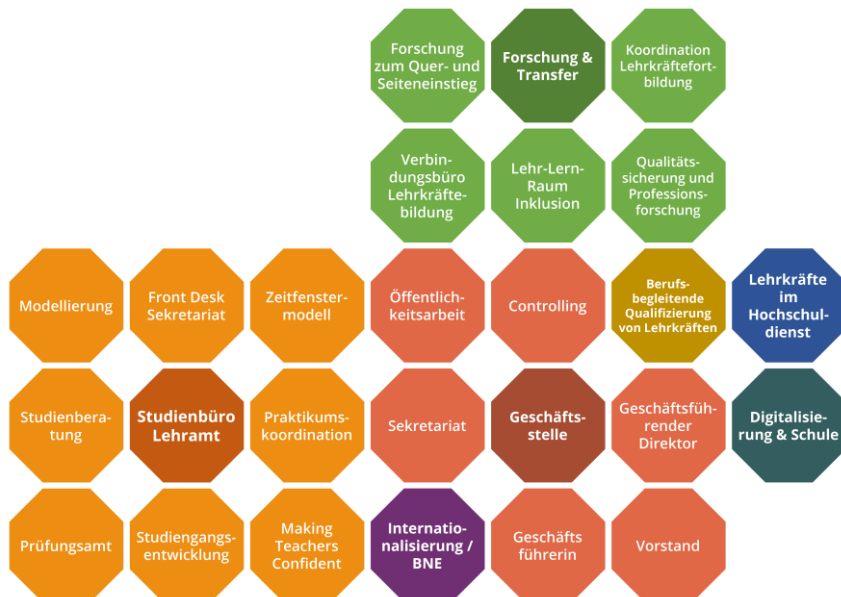
Abbildung 4: Rollen und Aufgabenfelder am ZLSB

Die Leitung des Zentrums wird durch einen Vorstand wahrgenommen, der von einer Geschäftsstelle unterstützt wird. Die Mitwirkung der beteiligten Fakultäten und Statusgruppen erfolgt über den Wissenschaftlichen Rat. Die Studierenden haben darüber hinaus eine eigene zentrale Vertretung. In den Arbeitskreisen wirken neben Hochschulangehörigen auch Vertreterinnen und Vertreter der Zweiten Phase und der Kultusbehörden mit. Auf den Internetseiten des ZLSB können sich Studierende umfassend zur Lehramtsausbildung an der TU Dresden informieren.