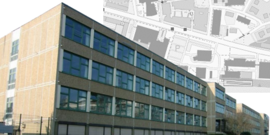
Seminargebäude 1, Zellescher Weg 22